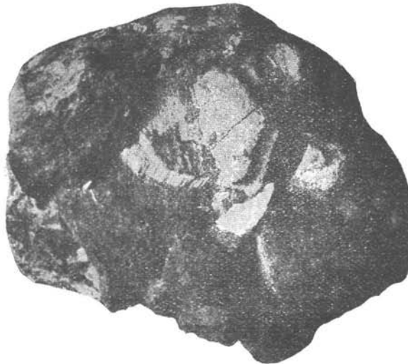
Konglomerat mit Schalenbruchstück eines Inoceramus .