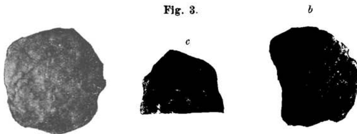
Nummulites cf. bolcensis Munier Chalmas.

Die Nummuliten sind klein, höchstens 4—5 mm im Durchmesser und von flach linsenförmiger Gestalt. Sie sind schlecht erhalten und weisen meistens eine stark zerfressene Oberfläche auf.