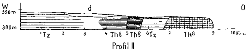
Durchschnitt in der Richtung W-O.