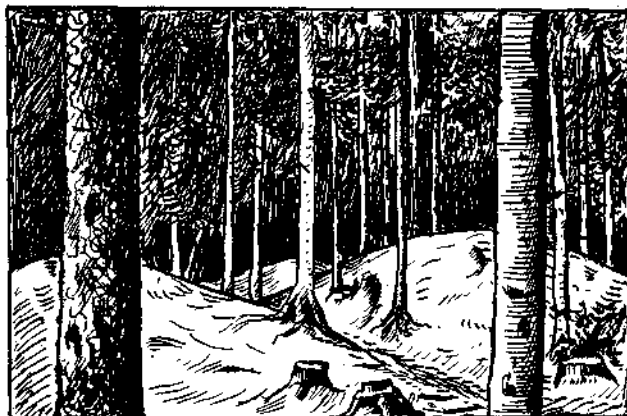
Abb. 2 a. Knappendorf bei Hirschwang. Stark verflachte Waschhalden im Hochwald; etwa 150 m östlich P. 677.

zwei Untersuchungsstollen (der Michailowicz- und der Schwarzhuber-Stollen [vgl. Lageplan]) nachgewiesen, die in den Vierzigerjahren des vorigen Jahrhunderts — augenscheinlich unter dem Eindrucke der oberflächlich sichtbaren gewaltigen Massenbewegung — verquerend zu der Zone der Waschaufen vorgetrieben wurden (vgl. Lageplan).