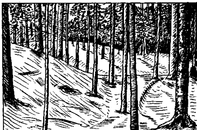
Abb. 2 b. Knappendorf bei Hirschwang. Waschhalden im Hochwald (etwa 300 m östlich P.677). Man sieht die 1 bis 5 m hohen Raithaufen, die sich meist überschneiden.

K. A. REDLICH berichtet, daß die beiden Stollen in einer Streichendstrecke von 15 Klaftern nur Erzschüre antrafen und daher eingestellt wurden 12) .