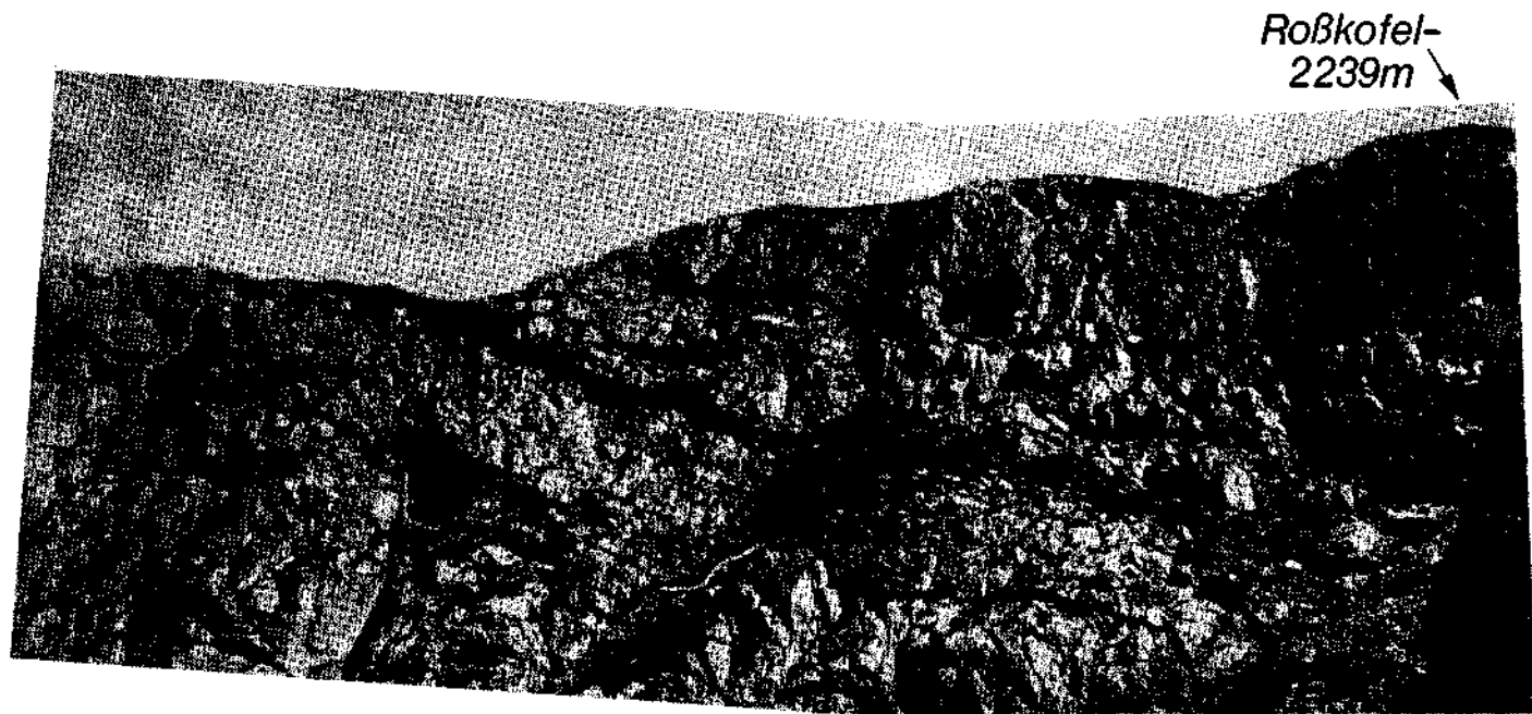
Abb. 7. Der Kalk-zu-Kalk-Kontakt zwischen Mitteldevon (unten) und Perm (oben) im südwestlichen Kessel unmittelbar unter dem Gipfel des Roßkofel.