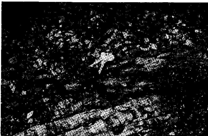
Abb. 2. Detail des Kontaktes von Abb. 1.

Die basalen Auernigschichten kappen den älteren Untergrund nicht ebenflächlich, sondern greifen materialbedingt in ein stark zerhacktes und zerbrochenes Relief unregelmäßig ein (vgl. Abb. 2).