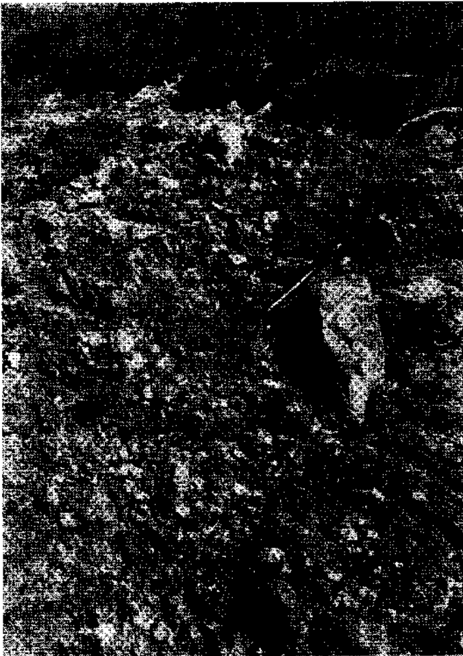
Abb. 3. Grob-Konglomerate an der Ostflanke des Leitenkogels.

Der Graben, der östlich des Leitenkogel (1845 m, Österr. Karte 198/3, Hochwipfel) in den Straniger Bach entwässert, schließt auf beiden Flanken in einer Höhe zwischen 1700 m und 1800 m (nicht bis zum Kamm reichend!) einen etwa