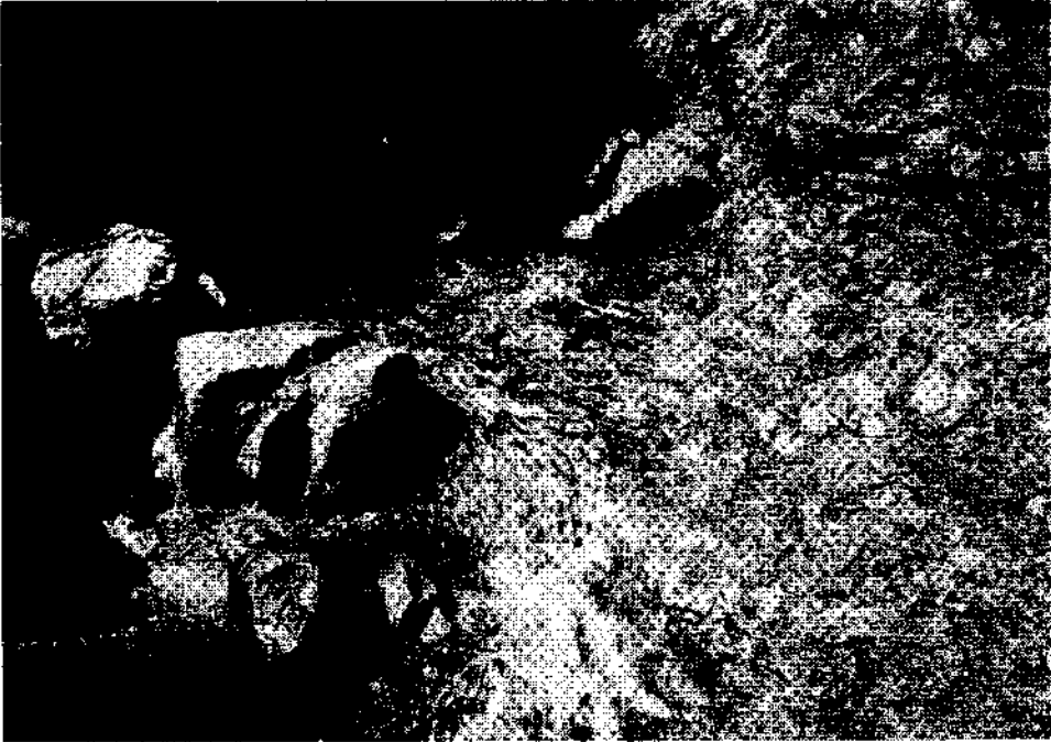
Abb. 6: Detail von Abb. 5 mit Kalkgeröllen, die in Schiefer an der Basis der geröllführenden Horizonte im Marchbachgraben aufgearbeitet sind.