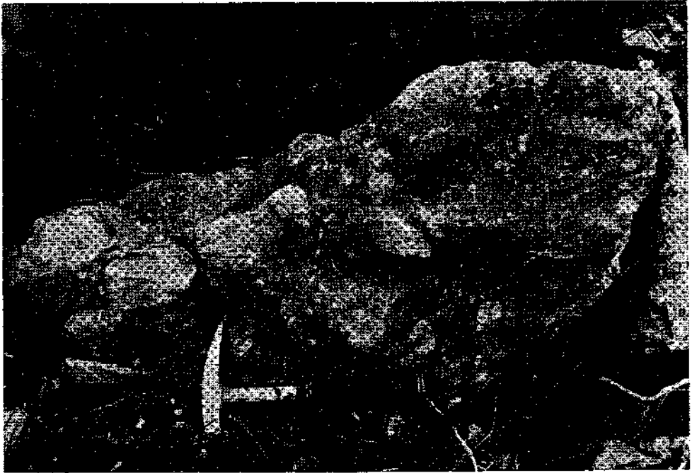
Abb. 4. Kalkkonglomerat-Block mit schlecht sortierten Kalkgeröllen aus Flaserkalken der Unterlage an der Straße Straniger Alm—Waidegger Alm.

Das Oberkarbon ist hier maximal 50 m mächtig und besteht aus Geröllschiefern bis Konglomeraten in mindestens drei Horizonten, milden und kompakten Sandsteinen sowie grauen und braunen Siltschiefern. An Fossilien fanden sich Pflanzen, Brachiopoden und Echinodermaten.