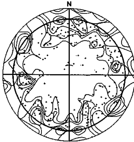
Abb. 3: Dichtelinien der Klüftpole aller Aufschlüsse in stereogr. Projektion. Der Äquator der Projektionskugel ist als innerer der beiden Kreise abgebildet