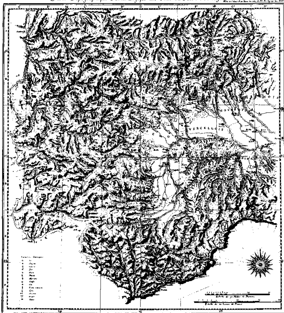
Abb. 4: ROBILANT, N. DE (1786): „Carte Topographique-Minéralogique des Etats du Roi en Terre Ferme.“ (Originalgröße: 47 cm × 53 cm).