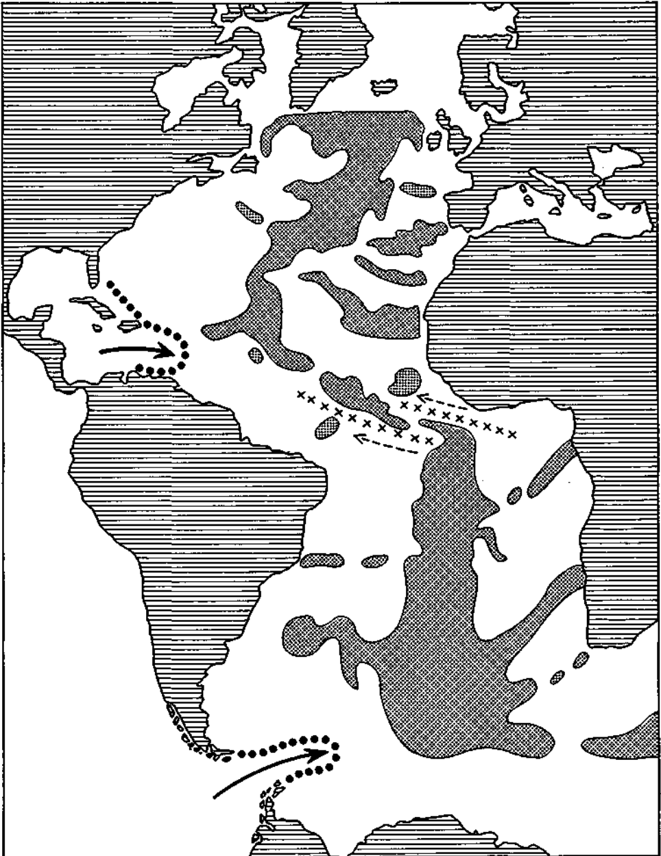
Abb. 2: Der Boden des Atlantischen Ozeans mit dem mittelatlantischen Rücken samt Seitenschwellen und Querstörungen (x). Bogen der Kleinen Antillen und der Südantillen (.....) durch Unterströmung entstanden. Nach AMPFERER 1941, umgezeichnet