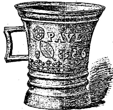
\frac{1}{3} d. nat. Gr.