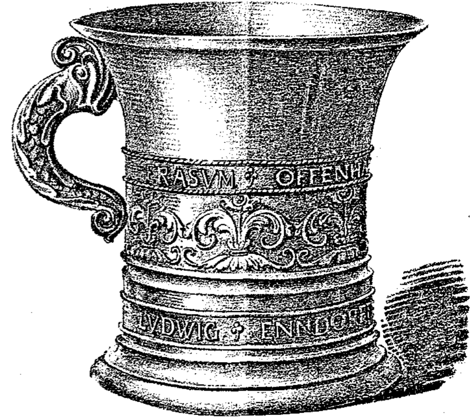
\frac{1}{2} d. nat. Gr.