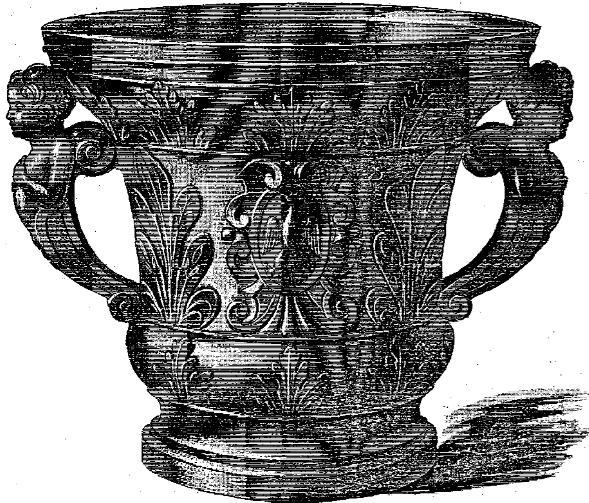
\frac{1}{2} d. nat. Gr.