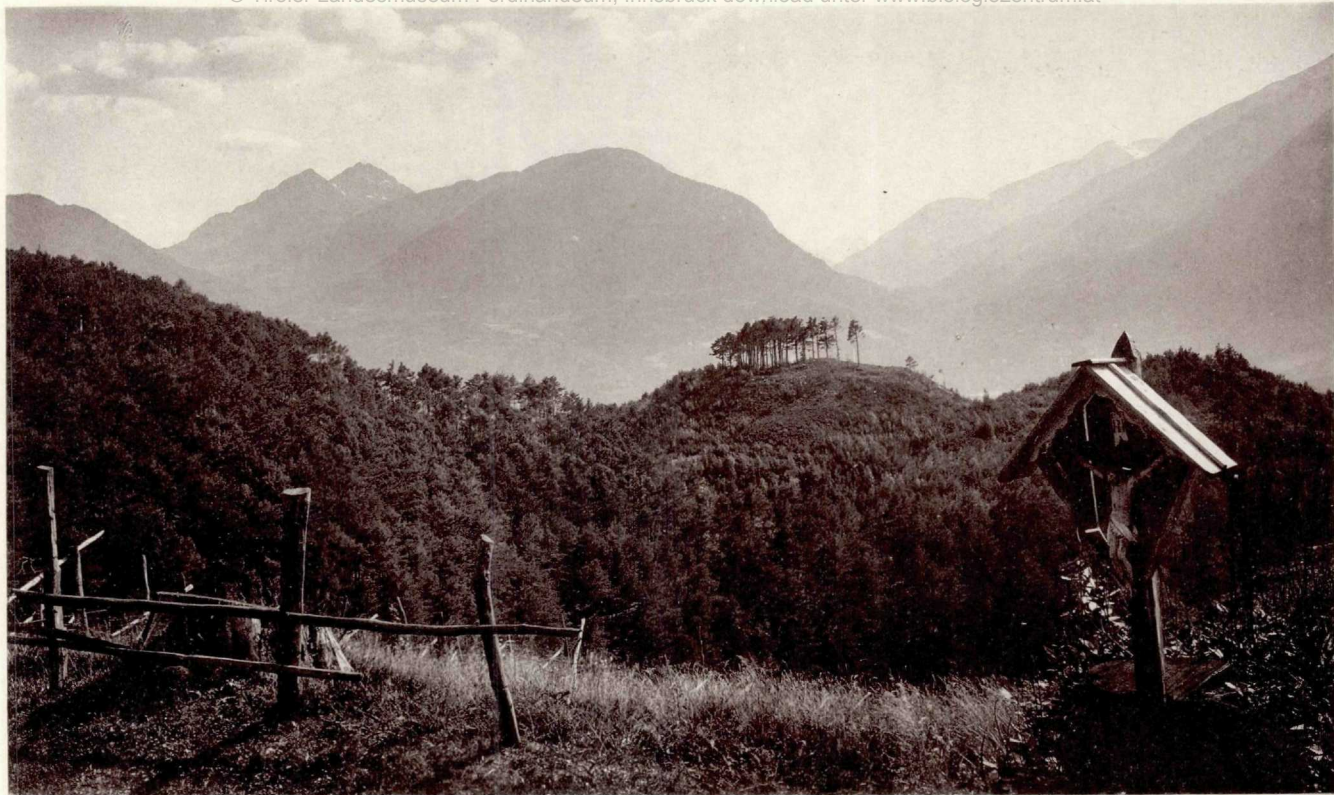
Der Sinichkopf von Nordosten