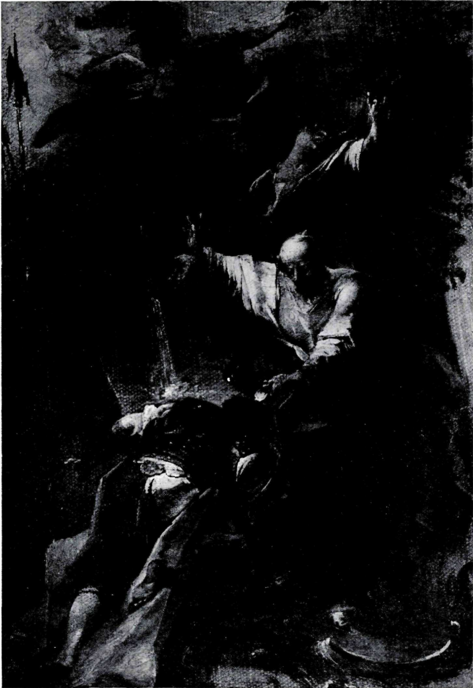
Abb. 1: Johann Wolfgang Baumgartner, um 1750, Petrus tauft im Kerker die Märtyrer Processus und Martinianus.