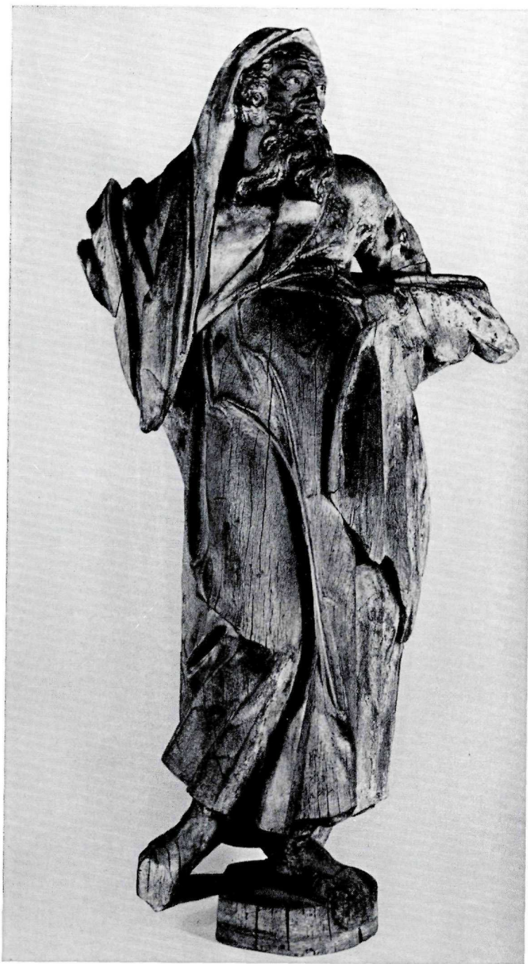
Abb. 4: Josef Anton Renn, hl. Joachim, um 1780.