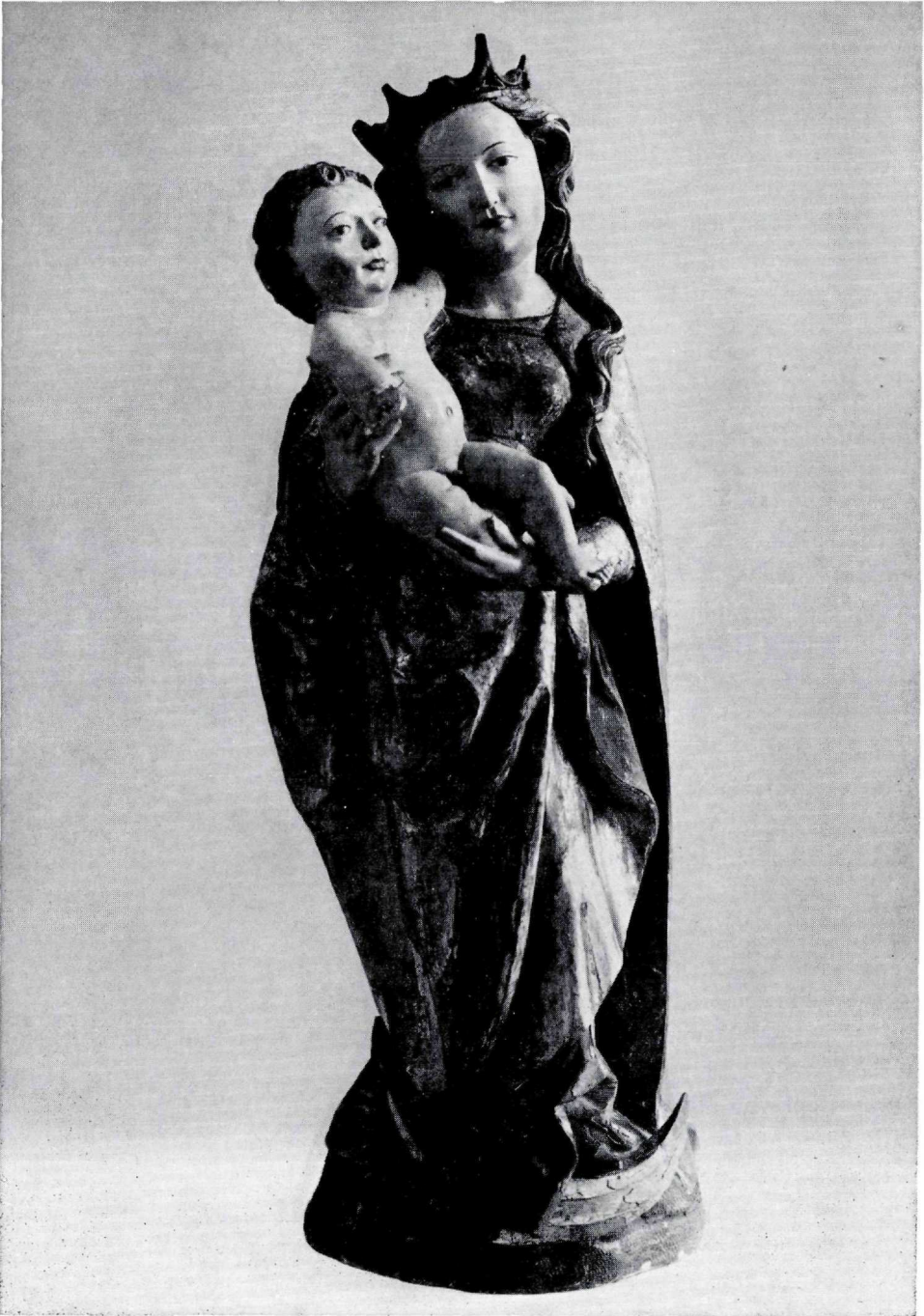
Abb. 3: Rupert Pöschl, Madonna mit Kind, um 1510.