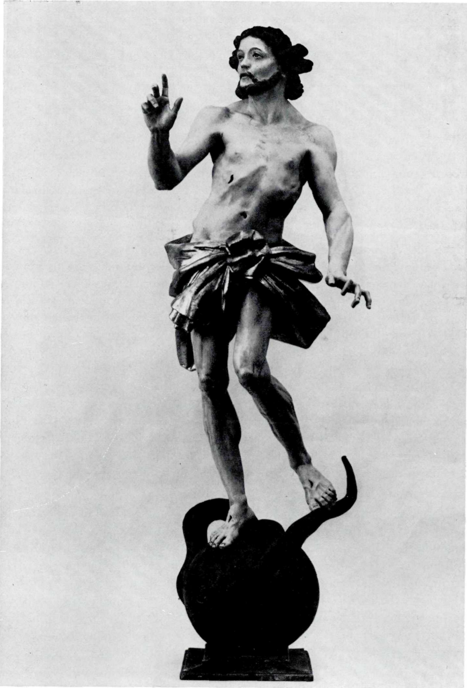
Abb. 1 Johannes Schnegg, Auferstandener, um 1775/80