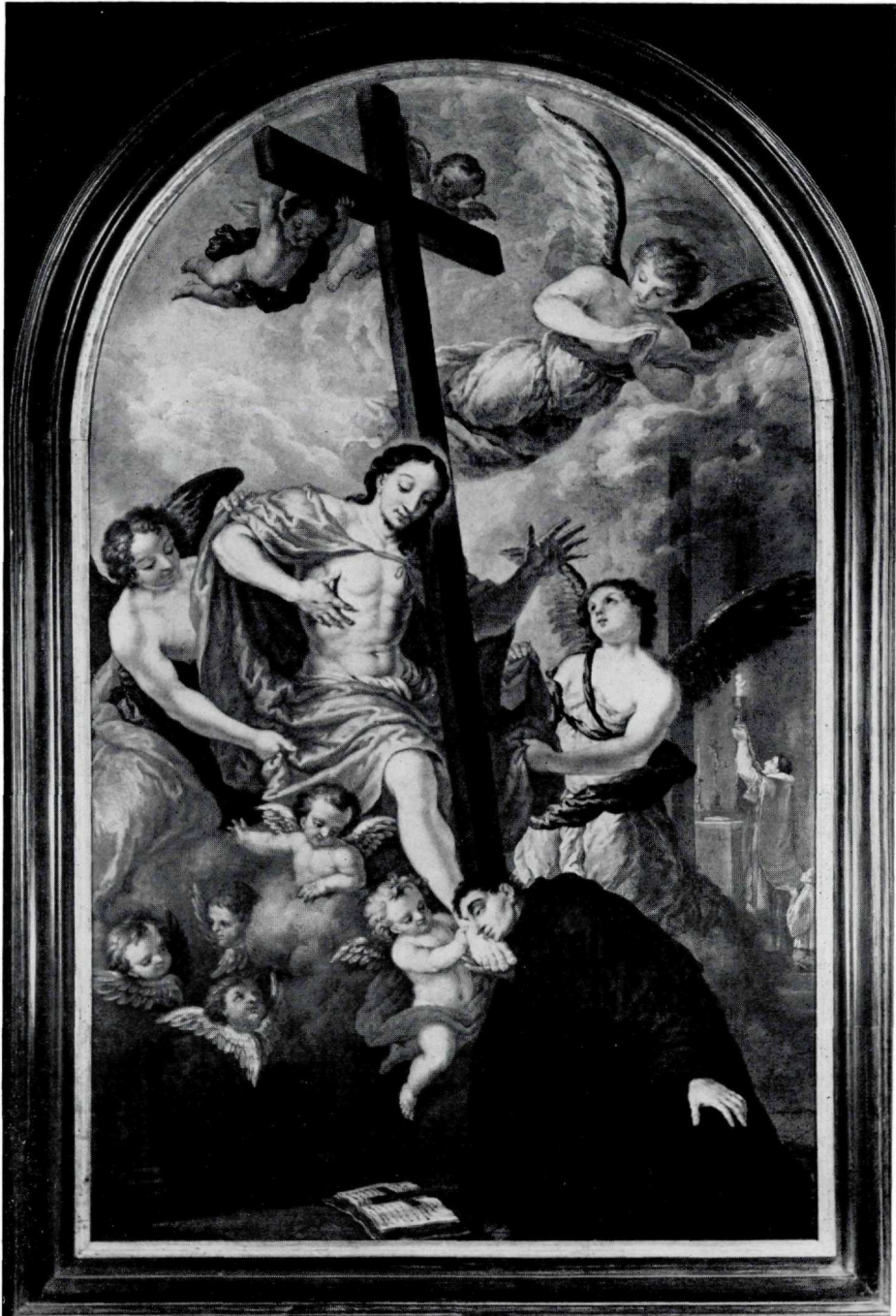
Abb. 2 Kaspar Waldmann († 1720), Der hl. Nikolaus von Tolentin küßt die Wundmale Christi