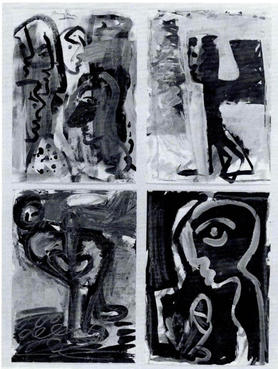
Siegfried Anzinger, Ohne Titel, 1980; Inv. Nr. A 63/1-4