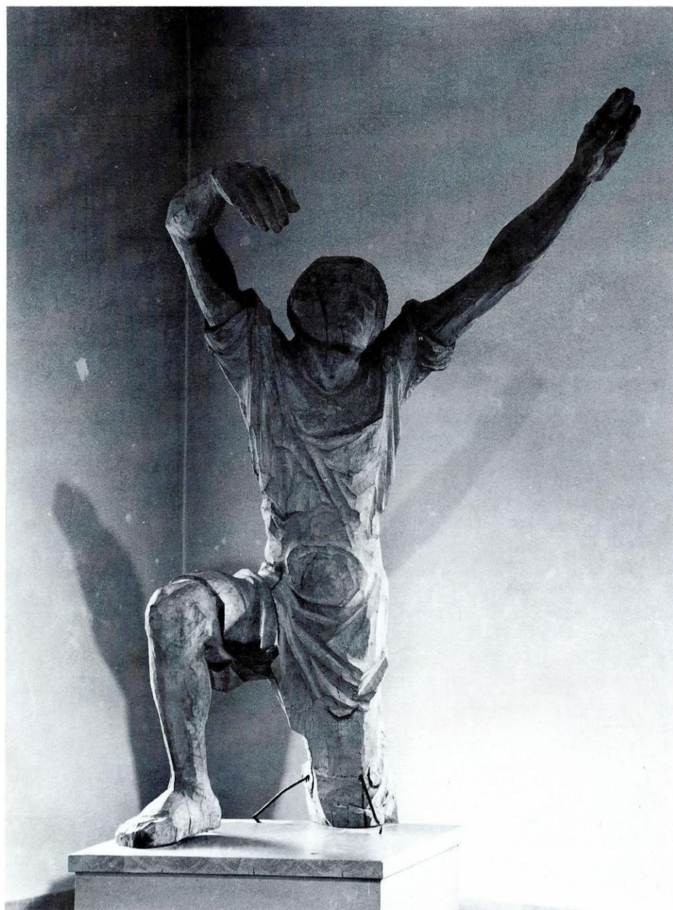
Sepp Baumgartner, Figur zu einem Kriegerdenkmal, 1927/28; Inv. Nr. P 2131