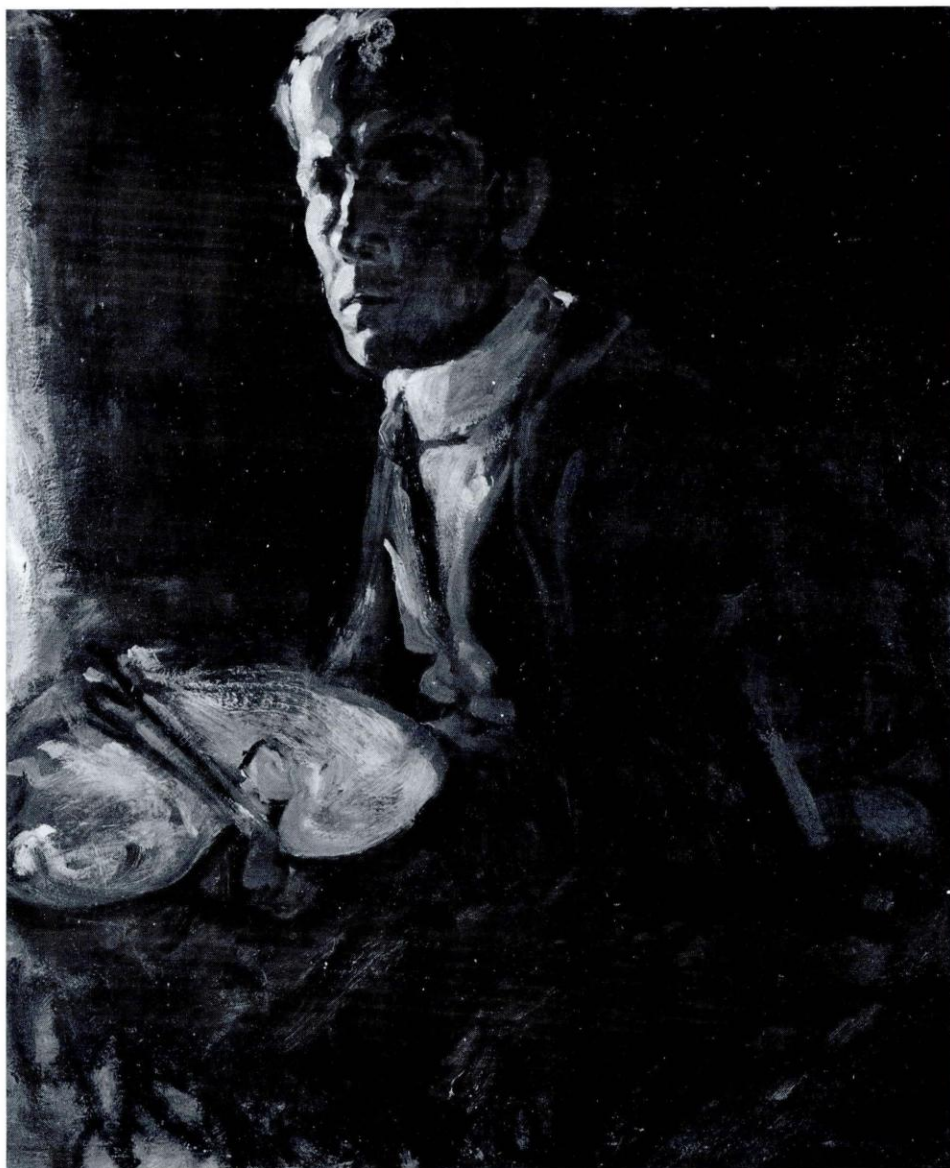
Alphons Schnegg, Selbstbildnis, 1921; Inv. Nr. Gem 3625