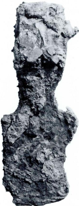
Wörgl, Grab 310, eisernes Beil vor und nach der Restaurierung