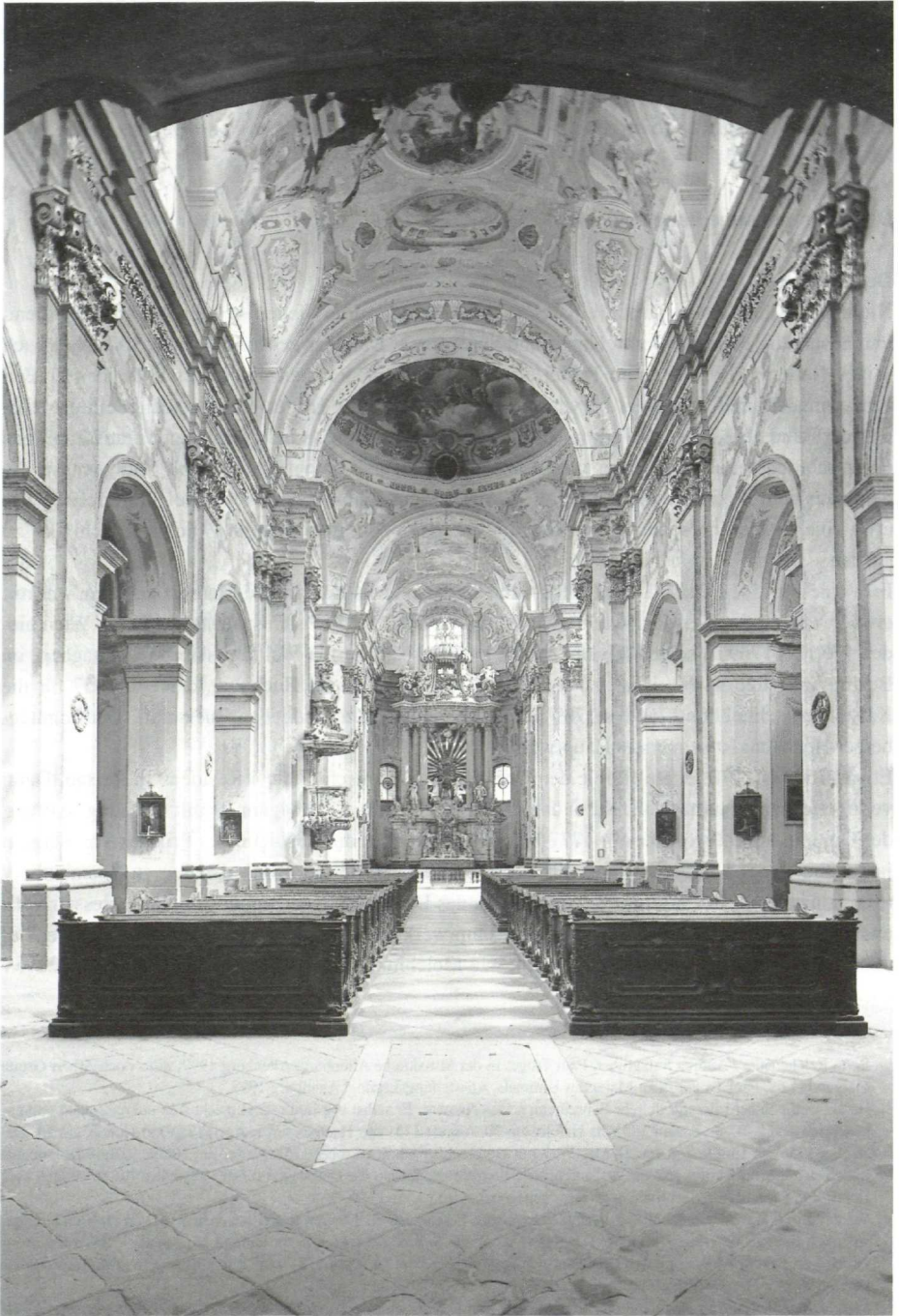
Wallfahrtskirche Sonntagberg, Blick durch Langhaus und Kuppelraum zum Hochaltar