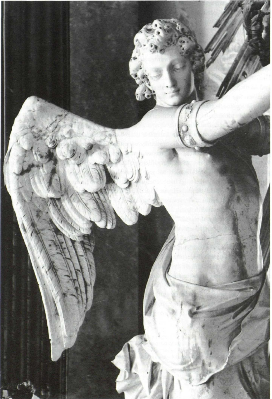
Hochaltar Sonntagberg, Engel beim Gnadenbild aus weißem Tiroler Marmor, Jakob Christoph Schletterer