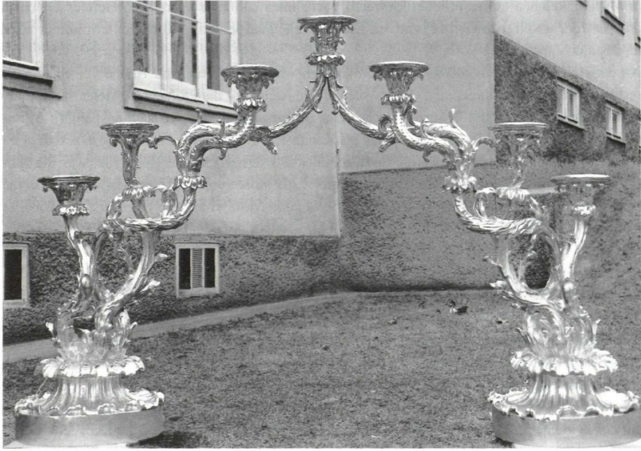
Der „siebenarmige“ Leuchter des Hochaltars Sonntagberg nach der Wiederherstellung durch Restaurator Michel Pfaffenbichler.

der Gott der Heerscharen.“ 45 Das ist der Ruf der Seraphim vor dem Throne Gottes in der Berufungsvision des Propheten Jesaja. 46