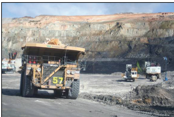
Abb. 5: „Premier Coal“ Steinkohletagebau (Perm) bei Collie (WA)

Im Rahmen des Kongresses fand eine Exkursion zu den Kohlefeldern bei Collie statt, wo Steinkohle im Tagebau gefördert wird und wo wir auch die typische Flora des Perms vom Gondwana-Kontinent finden konnten: Glossopteris sp.