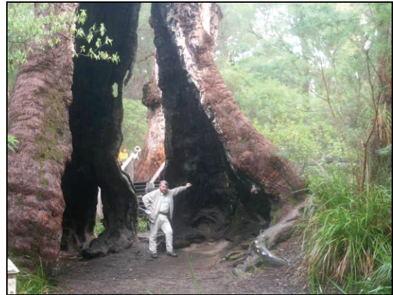
Abb. 16: Der Verfasser steht am größten und vermutlich auch ältesten, innen hohlen Eukalyptusbaum Westaustraliens. Sein Stammumfang misst 24 Meter.

Exemplare gibt, krönte die Reihe interessanter Tierbeobachtungen. Über unsere zoologischen Beobachtungen, auch die entomologischen, soll an anderer Stelle ausführlicher berichtet werden.