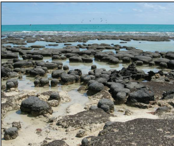
Abb. 11: Stromatolithe der Shark Bay bei Niedrigwasser