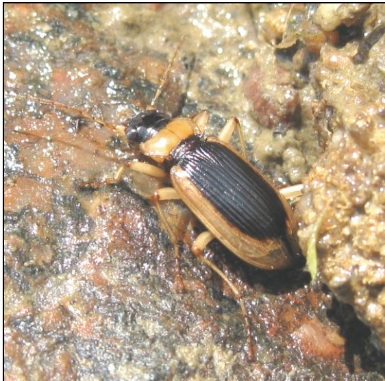
Abb. 8: Nebria livida

Ebenfalls bemerkenswert war dann noch Baris laticollis (Marsh.), ein kleiner Rüsselkäfer, der polyphag an Brassicaceen lebt, aber in den letzten Jahren kaum mehr gefunden werden konnte.