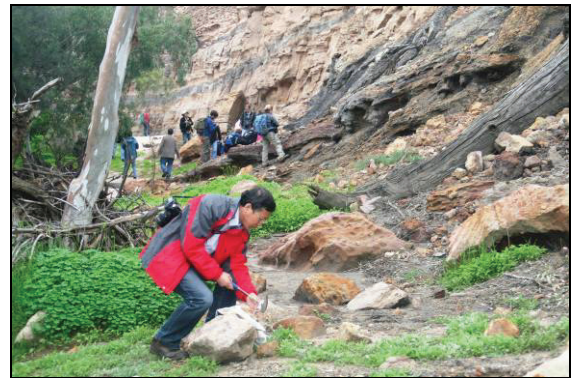
Abb. 7: Irvin River Ablagerungen 280 Millionen Jahre alt

Im Anschluss an die Vorträge fand eine mehrtägige geologisch-zoologisch-botanisch motivierte Exkursion (Post Symposium Tour) in den Norden West-Australiens statt.