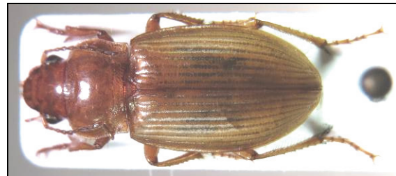
Abb. 4: Harpalus flavescens

Sie sind alle Spezialisten für sandige, nährstoffarme Böden, die in unserer von intensiver Landwirtschaft geprägten Zeit immer rarer werden.