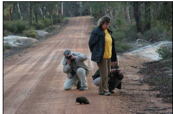
Abb. 17: Kurzschnabeligel ( Tachyglossus aculeatus ) sind zwar noch weit verbreitet aber trotzdem selten zu beobachten. Sie können bis 7 kg schwer und 45cm lang werden. Wir sahen in freier Wildbahn nur dieses eine Exemplar.