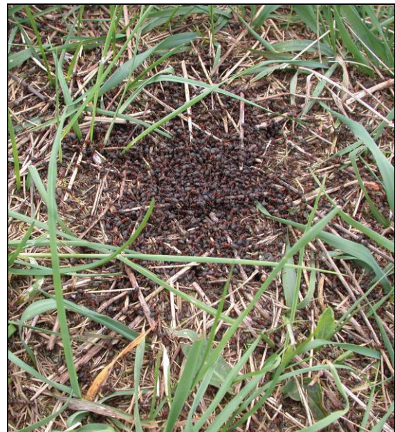
Abb. 3: Detail dieses Nestes mit sogenannter „Sonnungstraube“. Die Ameisen formen aktiv eine dunkle Fläche, die die Wärmeaufnahme begünstigt.

Anhand von Karten und Habitatfotos wurde gezeigt, wo welche Ameisenarten besammelt wurden. Es wurden vorwiegend solche Habitate aufgesucht, in denen die xerothermophilen Ameisen ihre höchste Diversität aufweisen.