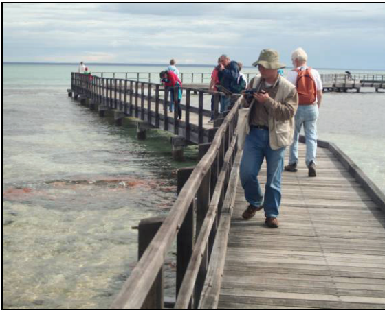
Abb. 10: In der Haifischbucht (Shark Bay Heritage) am Hamelin Pool sind die seltenen Vertreter der wenigen noch heute auf der Erde lebenden Stromatolithe touristisch gut erschlossen.