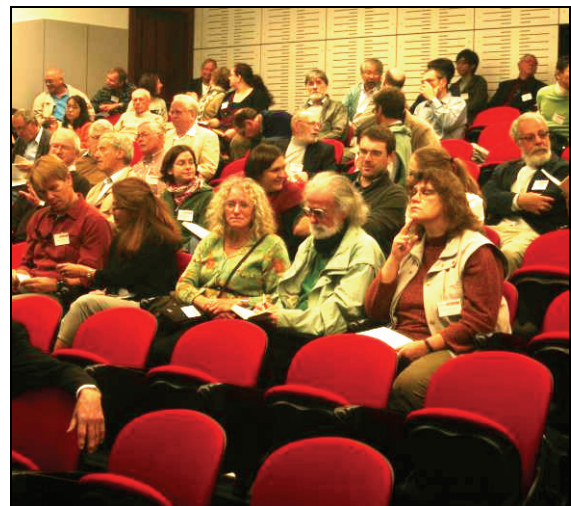
Abb. 2: Blick in den Vortragssaal in Perth, in der Winthrop Hall Undercroft der UWA (University of Western Australia)