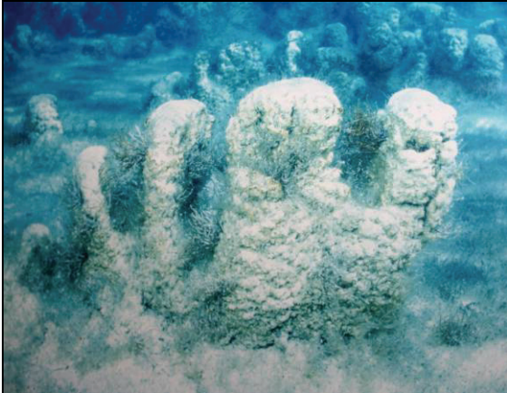
Abb. 9: Haifischbucht, lebende Stromatolithe mit Grünalgenbewuchs, Foto: Dr. Arthur Mory, Perth

Milliarden Jahren lebten und die für den Sauerstoff unserer Atmosphäre sorgten und damit erst höheres Leben auf unserem Planeten ermöglichten.