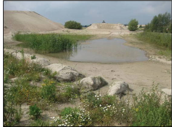
Abb. 3: Kiesgrube Zweedorf

So fanden sich auf den ausgedehnten Sandflächen einige Seltenheiten, die allesamt auf der Roten Liste der Laufkäfer Mecklenburg-Vorpommerns stehen: Amara municipalis (Duft.) (RL MV 3), Harpalus flavescens (Pill.Mitt.) (RL MV 4=R) und Harpalus calceatus (Duft.) (RL MV 1).