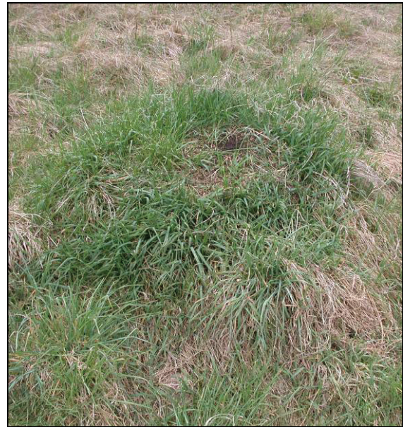
Abb. 2: Gesamtansicht eines Grasnestes

Den Hauptteil des Vortrages bildeten die Ergebnisse einer mehrjährigen Untersuchung der Nester von insgesamt 25 Arten der Ameisen (Formicidae) in Mecklenburg-Vorpommern (KLEEGERG & BUSCH 2010).