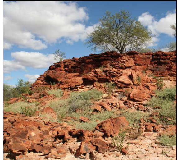
Abb. 12: Sandsteinformation des Perms bei Williambury Station, Foto: Prof. Dr. Carsten Brauckmann, Clausthal

Nach der Exkursion in den Norden von Westaustralien, den Besuchen im Perth Zoo (ZESSIN et al., 2012) und Nationalmuseum fuhren wir für 14 Tage in den Südwesten des Kontinents und besuchten mehrere Nationalparks.