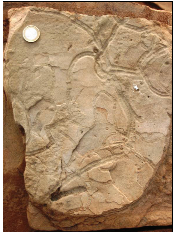
Abb. 13: Bisher unbeschriebene Spur aus den Sandstein-Sedimenten (Perm) am Minilya River

Bemerkenswerte Beobachtungen waren dabei, die mit ca. 3,7 Milliarden Jahren ältesten Gesteine der Darling Range (eine mehr als 1000 km lange Verwerfung mit einem Versprung von 2000 Metern).