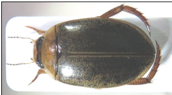
Abb. 2: Rhantus bistriatus

Bei unserem Besuch an der Warbel konnten wir zusätzlich einige Schwimmkäferarten feststellen, die bislang von hier noch nicht gemeldet waren: Coelambus impressopunctatus (Schall.), Agabus paludosus (F.), Ilybius fenestratus (F.), Ilybius quadriguttatus (Lacord.), Rhantus notatus (F.), Rhantus suturalis (M'Leay), Colymbetes fuscus (L.), Hydaticus seminiger (Geer), Hydaticus transversalis (Pont.), Hydaticus modestus Shp., Acilius canaliculatus (Nicol.), Graphoderus cinereus (L.) und Graphoderus austriacus (Sturm). Faunistisch besonders interessant aber ist vor allem das Vorkommen von mehreren Exemplaren von Rhantus bistriatus (Bergstr.).