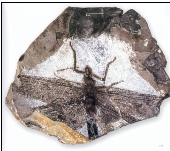
Abb. 4: Namurotypus sippeli BRAUCKMANN & ZESSIN, 1989, Holotypus, Namurian B (315 Millionen Jahre alt); Hagen-Vorhalle, Ruhrgebiet, Deutschland, die bedeutendste fossile Libelle, die wir in unserem Vortrag zeigten.

Im Rahmen des Kongresses fand eine Exkursion zu den Kohlefeldern bei Collie statt, wo Steinkohle im Tagebau gefördert wird und wo wir auch die typische Flora des Perms vom Gondwana-Kontinent finden konnten: Glossopteris sp.