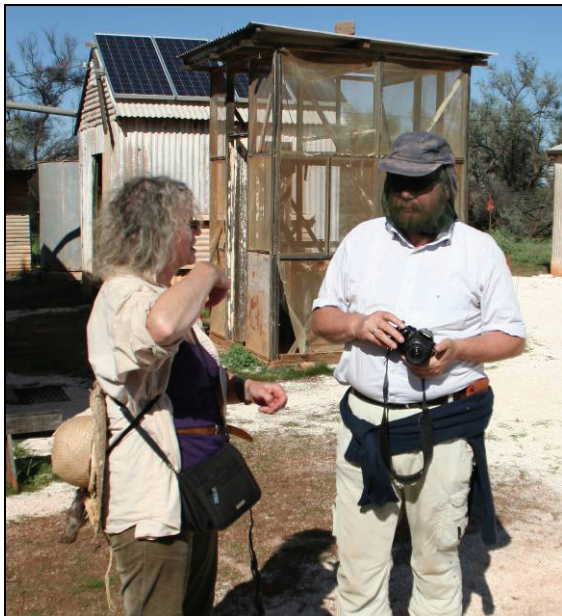
Abb. 15: Eine unangenehme Bekanntschaft mit der Entomofauna Australiens ist die allgegenwärtige Buschfliege, gegen die man sich nur mit einem Netz über dem Kopf einigermaßen schützen kann.

Wir sahen riesige Eukalyptus-Bäume, der gewaltigste hatte einen Stammumfang von 24 Meter. Baumfarne und Grasbäume waren die exotischen Vertreter der australischen Flora und begeisterten uns immer wieder.