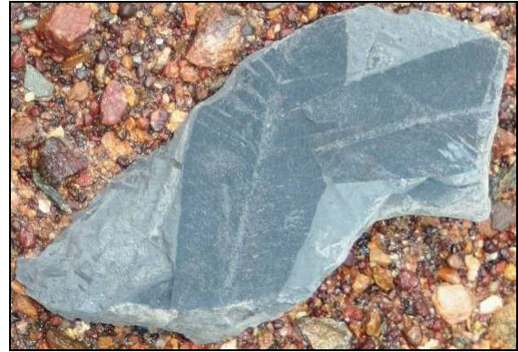
Abb. 6: Glossopteris-Blätter, ca. 20 cm lang

Im Anschluss an die Vorträge fand eine mehrtägige geologisch-zoologisch-botanisch motivierte Exkursion (Post Symposium Tour) in den Norden West-Australiens statt.