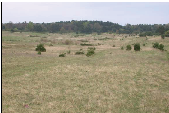
Abb. 1. Windgeschützte flache Senke mit einer Kolonie von Formica (Formica) pratensis RETZ. bei Zierke im April 2008.

Im Vortrag wurden zunächst ökologische und physiologische Besonderheiten von Ameisen herausgearbeitet und Begriffe, die für das Verhältnis von Ameisen und anderen Insekten wichtig sind, definiert. Die Trophobie beschreibt die Wechselwirkungen bei der ein Insekt einer anderen Art Sekrete oder Exkremente des eigenen Körpers bietet und dafür Schutz vor Feinden und andere Vorteile genießt (z. B. Ameisen – Blattläuse). Unter Trophallaxis versteht man den sozialen Futterrausch (Larven und übrige Stockinsassen) bei dem durch Mund-zu-Mund Fütterung flüssiger Kropfinhalt ausgetauscht wird. Die Myrmecophilie steht für die vorübergehende oder dauerhafte Vergesellschaftung von Arthropoden mit Ameisen, die in deren Nestern und von deren Vorräten und Brut leben. Im Folgenden wurde die einschlägige Literatur über Ameisen kurz vorgestellt (HÖLLDOBLER & WILSON 1990, 1995, SEIFERT 2007), auf dessen Basis eine Reihe von Verhaltensweisen zwischen der jeweiligen Ameisenart und ihren Myrmecophilen illustriert und erläutert wurde.