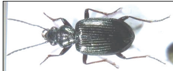
Abb. 11: Bembidion punctulatum

Dort fanden wir bei einer Exkursion am 10.9.2011 am Uferbereich eine fast identische Käferfauna vor. Neben Stenus palposus und Bembidion ruficolle war hier noch zusätzlich Bembidion punctulatum Drapiez vorhanden.