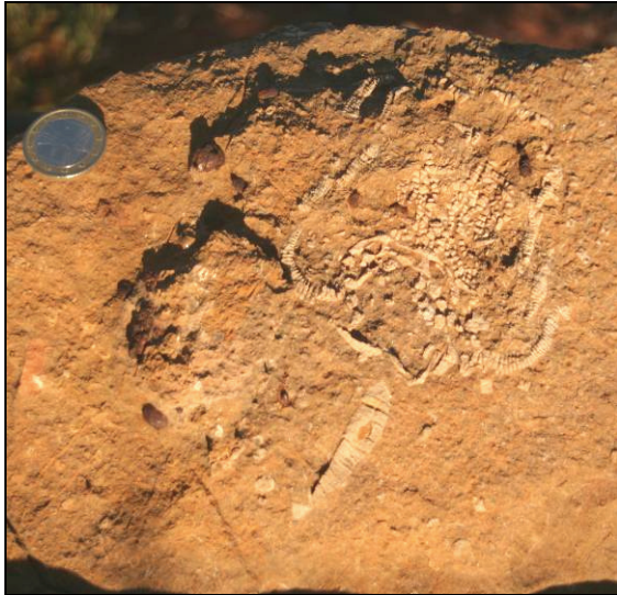
Abb. 14: Kelch einer Seelilie (Permokarbon), gefunden im Buschland in der Umgebung von Williambury Station