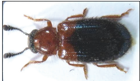
Abb. 10: Necrobia ruficollis

Dort fanden wir bei einer Exkursion am 10.9.2011 am Uferbereich eine fast identische Käferfauna vor. Neben Stenus palposus und Bembidion ruficolle war hier noch zusätzlich Bembidion punctulatum Drapiez vorhanden.