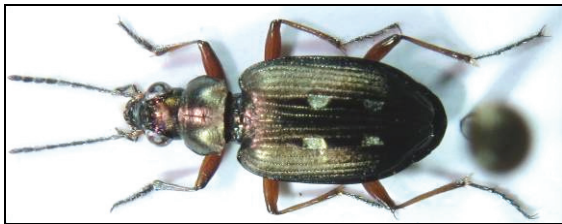
Abb. 7: Bembidion velox

Auch er ist neben seinem Vorkommen an den Steilküsten der Ostsee ein typischer Bewohner solcher Kiesgruben und zeigt wieder einmal deutlich, wie wertvoll diese Biotope für unsere Natur sind.