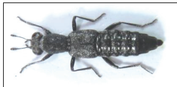
Abb. 6: Stenus palposus

Besonders interessant waren aber die Wasserränder. Dort liefen im Sonnenschein einige Bembidion ruficolle (Panz.) und Stenus palposus Zett. umher.