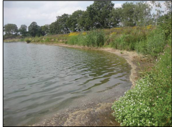
Abb. 9: Lebensraum von Nebria livida

Ein ähnlicher Lebensraum findet sich bei Valluhn östlich von Zarrentin. Auch hier liegen große Kiesgruben mit einer Ausprägung wie in Zweedorf.