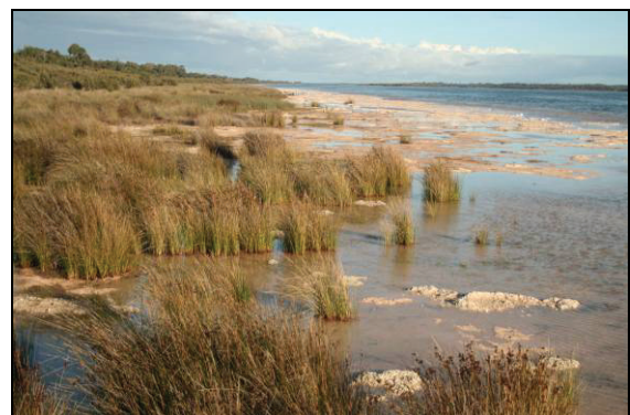
Abb. 8: Lake Clifton mit Thrombolithen (Süßwasserstromatolithe)

Höhepunkte dieser Reise waren die grandiosen, großflächig aufgeschlossenen Sandsteinablagerungen des Karbon und Perm (ca. 300 Millionen Jahre alt) im Perth-Carnarvon Basin mit Fossilien und Spuren, lebende Stromatolithe in der Haifischbucht (Shark Bay) und die Thrombolithe in einigen küstennahen Seen.