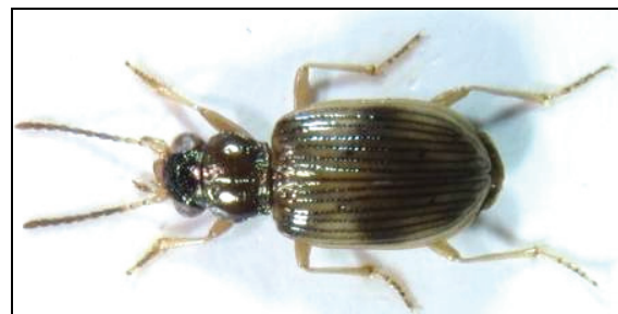
Abb. 5: Bembidion ruficolle

Sie sind alle Spezialisten für sandige, nährstoffarme Böden, die in unserer von intensiver Landwirtschaft geprägten Zeit immer rarer werden.