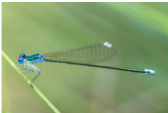
Abb. 1: Weibchen der Zwerglibelle ( Nehalennia speciosa). östlich von Wesenberg (Mecklenburg-Vorpommern).