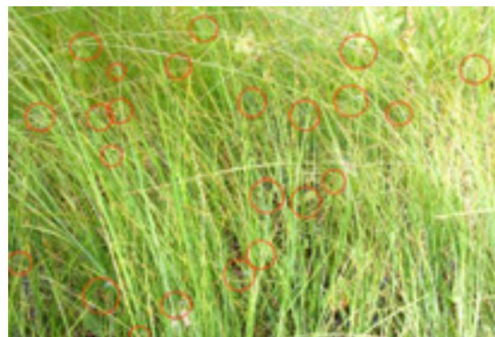
Abb. 2: Zwerglibellen (23 Ex. auf 1 m 2 ) versteckt in der Vegetation – mit roten Kreisen umrahmt.