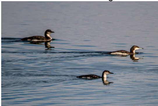
Prachtaucher am Starnberger See

Prachtaucher: Regelmäßig am Starnberger See zu beobachten. 33 Individuen bei der Wasservogelzählung Mitte des Monats. Ansonsten fast täglich Meldungen über Prachtaucherbeobachtungen von vielen Beobachtern.