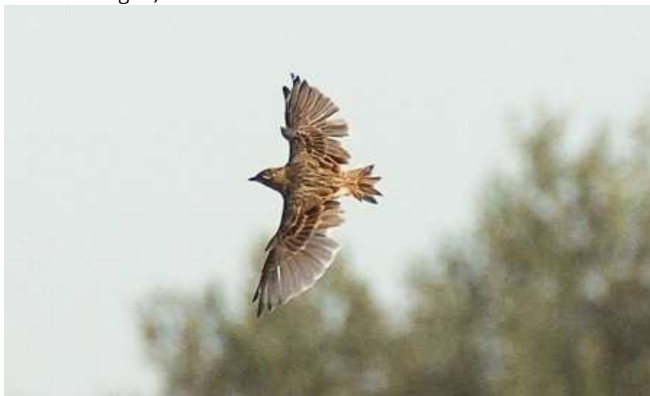
Mausernde Feldlerche

Insgesamt 11 Beobachtungen(1-26 Ind.) auf den Feldern oder ziehend am Höhenberg (diverse Beobachtungen)