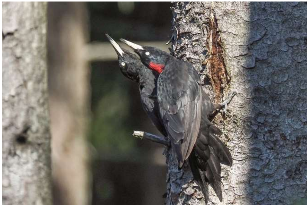
Drohschwenkende Schwarzspechtweibchen

Insgesamt 20 Beobachtungen, darunter eine sehr schöne Fotostrecke über "drohschwenkende" Schwarzspechtweibchen