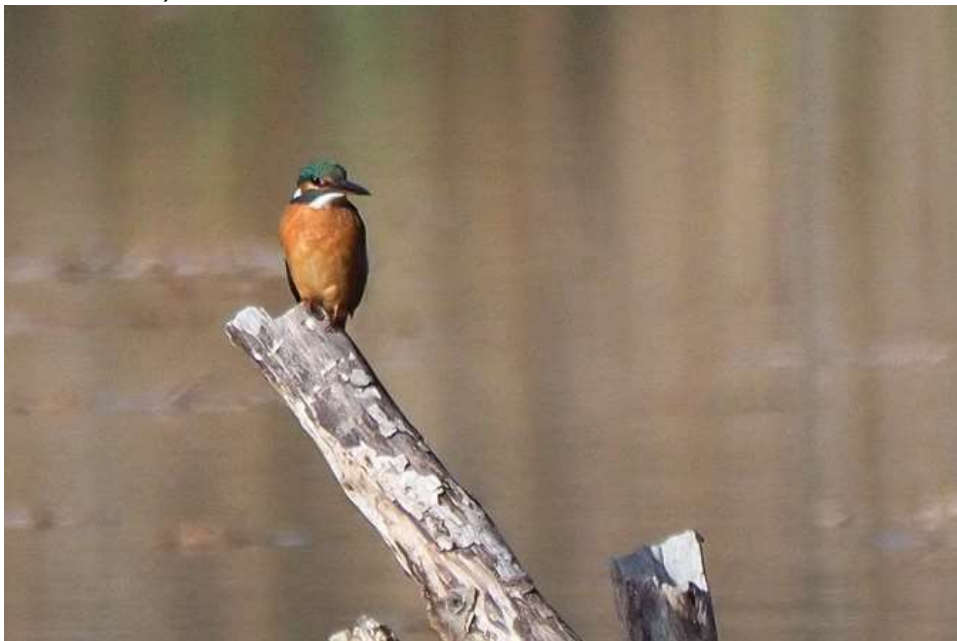
Eisvogel (Foto: ornitho.de – Antje Geigenberger)

Insgesamt 9 (jeweils 1 Ind.) Eisvogelbeobachtungen aus unterschiedlichen Gebieten (u.a. von der Würm, Leutstettener Moos, Starnberger See, aus Andechs, Maisinger See) im Landkreis (viele Beobachter)