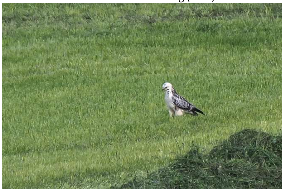
Mäusebussard – helle Morphe

Wie üblich viele Beobachtungen von Mäusebussarden, darunter ein sehr helles Individuum am 13.11.2018 bei Weßling (AGei)