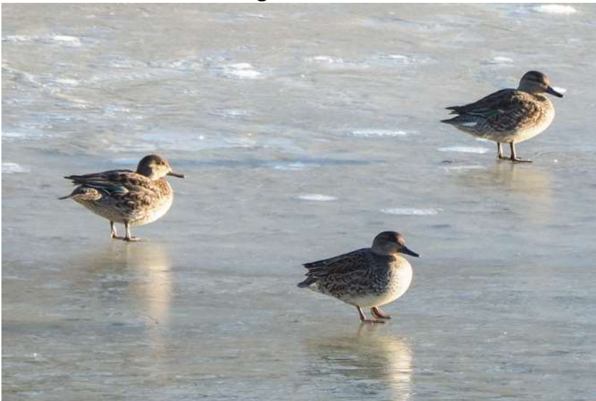
Krickenten auf zugefrorenem Weiher

28.12.2018 4 Ind. in Kiesgrube Unterbrunn (AGei)