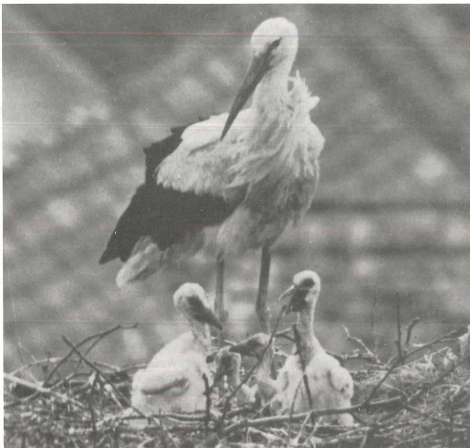
Abb. 1. Oggelshausen, 23. 6. 1966: ♂ „Ramms-Schnabel“ über dem verschiedenaltigen Geheck (Junge kaum 8 bzw. rund 18 Tage alt).

hinderung der Elterntiere beim Hudern der Jüngsten infolge des erheblichen Altersunterschieds zurückzuführen sind. Nahrungsknappheit sowie mangelnde Brutreife scheiden als Ursachen offenbar aus.