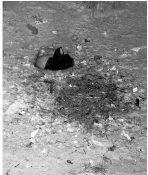
Abb. 3: Ein Mauersegler kehrt zum Nest zurück. – A common swift returns to the nest.