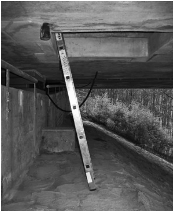
Abb. 2: Einsteig in die Brücke. – Entrance to the chambers.

Die Überlebensrate der Jungvögel war 2007 mit 9,3% gering. Nur 7 von 75 Jungen haben überlebt und die Nester erfolgreich verlassen. Der Grund dafür war höchstwahrscheinlich die extrem lange Schlechtwetterperiode während des Sommers. Im Durchschnitt erreichten die überlebenden Nestlinge ihre höchste Körpermasse von 43,8 \pm 9,0 g am 31. Tag. Die Jungen verließen mit einem Durchschnittsalter von 38 (32 - 43) Tagen das Nest. Zu diesem Zeitpunkt wogen die Jungvögel durchschnittlich 41,2 \pm 8,3 g. Ähnliche Körpermassen von Mauerseglern fanden Lack & Lack (1951) und Martins & Wright (1993).