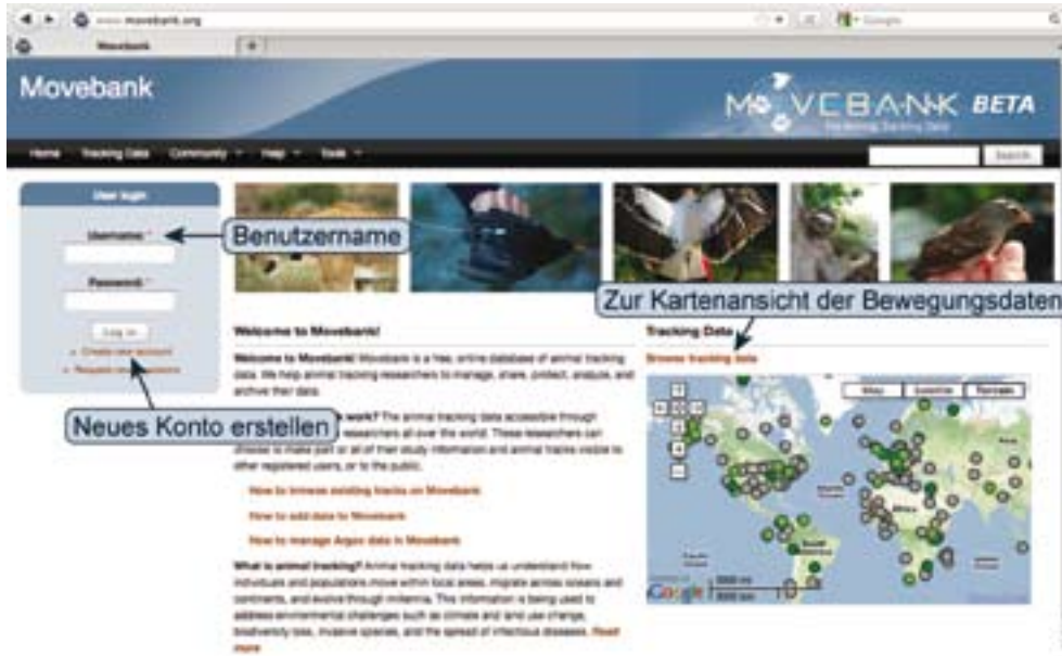
Abb. 1: Startseite von Movebank.

Befehl „Create new account“ eines anlegen und Ihren Benutzernamen dabei frei wählen. Sie erhalten dann eine E-mail mit weiteren Instruktionen. Die Verwalter von Studien, die nicht frei zugänglich sind, können Ihnen unter diesem Benutzernamen einen persönlichen Zugang freischalten. Sie können Movebank auch ohne Anmeldung benutzen. Dann haben Sie nur Zugang zu den Projekten, deren Daten frei zugänglich sind.