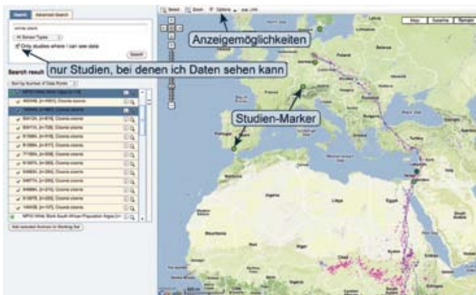
Abb. 2: Anzeigefenster für die Lokalisierungsdaten und Wege.