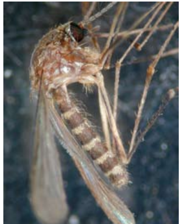
Abb. 2: Hauptüberträger der Usutu-Viren ist in Europa die häufige und weit verbreitete Gemeine Stechmücke oder Nördliche Hausschnake Culex pipiens . – Main vector of Usutu virus in Europe is the widespread and abundant Common Mosquito or House Mosquito Culex pipiens.

zusammen. Je wärmer es ist, umso höher ist die Fortpflanzungsrate der Stechmücken. Auch die Replikation der Viren in den Mücken (Zeitspanne zwischen Aufnahme infizierten Blutes bis zur Fähigkeit erworbene Viren weiter zu geben) verläuft bei einer Erhöhung der Temperatur schneller. Stechmücken leben mehrere Monate, infizierte Mücken bleiben lebenslang infektiös. Für die Mücken- und Virusvermehrung günstige Temperaturen liegen in Europa bei über 25 °C. Die Übertragungswahrscheinlichkeit von Viren hängt mit der Zahl der Stechmücken- bzw. Stichkontakte zusammen und ist in sommerlichen Hitzeperioden mit einer hohen Mückenzahl und schneller Virenvermehrung am größten. Beim Wiener Ausbruch 2003 lagen die Juni/August-Temperaturen über 3 °C über dem langjährigen Mittel (Schönwiese 2004 in Rubel et al. 2008). In Wien fanden Ausbrüche nur in Gebieten mit jährlich mehr als zehn heißen Tagen (früher „Hitze- bzw. Tropentage“ genannt) mit 30 °C oder darüber statt (Brugger & Rubel 2009). In Mannheim lagen während des Ausbruchs 2011 zwischen Juni und September 22 Tage bei oder über 28 °C (Quelle www.wetteronline.de ). Überschwemmungen wie die Jahrhundertflut in Wien 2002 oder in Amerika beim Hurrikan „Katrina“ hatten keinen nennenswerten Einfluss auf Culex -Stechmückenpopulationen (Franon 2005 in Rubel et al. 2008).