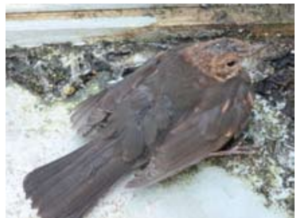
Abb. 3: Von einer Usutu-Virus-Infektion betroffene Amseln zeigen ein zerzaustes Gefieder, haben Gleichgewichtsstörungen und fehlendes Fluchtverhalten. – Blackbirds affected by Usutu virus infection show ruffled plumage, imbalance disorder and a lacking escape behaviour.

Nach den vorliegenden Daten ist in Europa die Amsel eine für USUV besonders empfängliche und daher stark betroffene Art. Nachdem es (noch) keine Hinweise auf Ursachen einer offenbar artspezifischen Anfälligkeit (wie Besonderheiten des Immunsystems oder der Umgang mit bzw. die Reaktion auf eine USUV-Infektion) gibt, sind möglicherweise die jahreszeitlichen Rahmenbedingungen zumindest mitverantwortlich oder bahrend für die hohe Zahl betroffener Amseln und anderer Singvögel. Aus verschiedenen Regionen gibt es seit dem USUV-Ausbruch in Südwestdeutschland ernst zu nehmende Hinweise auf deutliche Abnahmen verbreiteter Singvogelarten, die sich möglicherweise nicht in den Totfundzahlen abbilden.