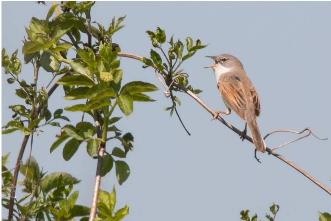
Abb. 6 Dorngrasmücke

Insgesamt wurden 68 Vogelarten festgestellt. Circa die Hälfte der Arten wurde als Brutvogel eingestuft. Bei 19 Arten konnte ein Brutnachweis (Brutzeitcode C) erbracht werden, bei 12 Arten besteht Brutverdacht (Brutzeitcode B), 6 Arten wurden zur Brutzeit im Gebiet festgestellt (Brutzeitcode A).