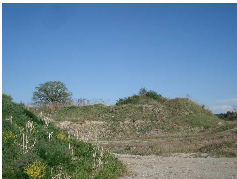
Abb. 4 Im Süden des Untersuchungsgebiets