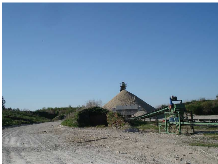
Abb. 3 Förderbandstrecke