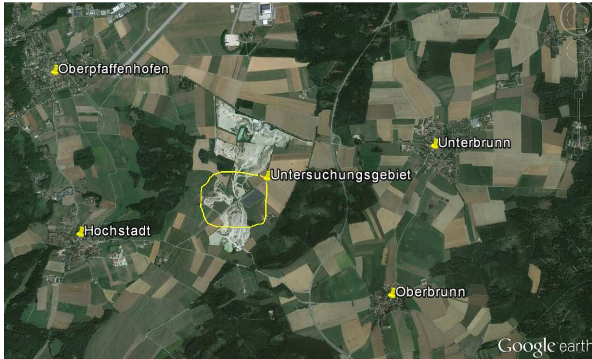
Abb. 1 Übersichtskarte Kiesgruben

Die Kiesgruben liegen auf dem Gebiet der Gemeinden Gauting bzw. Weßling, südlich der Staatsstraße 2349 von Unterbrunn nach Oberpfaffenhofen. Im Südwesten des Gebiets liegt die Ortschaft Hochstadt, im Südosten die Ortschaft Oberbrunn (siehe Abb. 1). Das gesamte Areal der Kiesgruben umfasst ca. 90 ha. Davon wurden ca. 25 ha im mittleren bzw. südlichen Bereich der Kiesgruben untersucht.