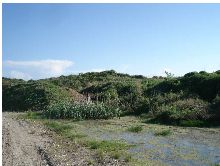
Abb. 2 Tümpel in der Kiesgrube

Steilwänden, verbuschten Flächen und vegetationsarmen Flächen (siehe Abb. 2 bis Abb. 4). Einzelne markante Bäume dienen Greifvögeln als Anstz. Feldhasen und Rehe können in den Kiesgruben regelmäßig beobachtet werden, ebenso gab es Beobachtungen von Fuchs und Dachs.