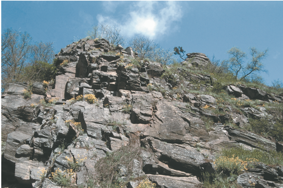
Abb. 4: Therasburger Gneis (intermediärer Orthogneis) am Überstieg beim Umlaufberg.

Struktur. In der feinkörnigen Grundmasse, die hauptsächlich aus dunkelbraunem Biotit und Quarz, untergeordnet aus Muskovit und Zirkon besteht, finden sich größere Feldspat-Einsprenglinge aus perthitischem Orthoklas und Plagioklas (BATÍK et al. 1993). Der intermediäre Orthogneis kann als Abkömmlinge von granodioritischen bis dioritischen Gesteinen angesehen werden. Nach FUCHS (1993) ist er wahrscheinlich ein Äquivalent des Therasburger Gneises (HÖCK 1991) im Süden auf Blatt Horn. Es ist ein plattig-bankiger, blockig verwitternder Gneis mit gut ausgeprägter, Nordost-Südwest verlaufender Lineation (FUCHS 1993, 1995, 1999). Der granodioritische Gneis ist vom Umlaufberg durch den Schwarzwald nach Merkersdorf zu verfolgen. Er ist besonders gut am Umlaufberg zu studieren, wo er am Überstieg unterhalb des Aussichtsplateaus, am Weg zum Umlauf, wandförmig aufgeschlossen ist (Abb. 4; FUCHS 1999).