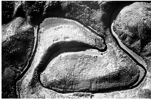
Abb. 6: Luftbild des Doppelmäanders der Thaya mit dem Umlaufberg (unten) und Ostroh (Stallfirst, oben).

An anderen Stellen an der Thaya und der Fugnitz erfolgte jedoch durch leichter erodierbare Gesteine der Durchbruch der Mäanderbögen mit der anschließenden Bildung abgeschnürter Talmäander und isolierter Umlaufberge. Ein besonders schönes Beispiel für einen solchen verlassenen Mäander findet sich in der Flur Lipina bei Devět mlýnů (Neun Mühlen) im Bereich des Thaya-Granits (IVAN & KIRCHNER 1994, BRZÁK 1997).