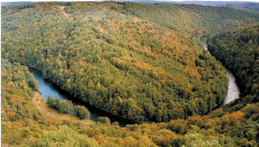
Abb. 1: Talmäander der Thaya beim Stierwiesberg (Býčí hora) südöstlich von Vranov nad Dyjí.

Der grenzüberschreitende Nationalpark Thayatal-Podyjí liegt am Ostrand des Waldviertels, an der Grenze zum Weinviertel und gehört zur Böhmisches Masse, einer der geologisch ältesten Teile Österreichs und auch Europas. Wie in kaum einem anderen Teil Österreichs blieben Gesteine aus so weit auseinander liegenden Epochen der Erdgeschichte nebeneinander vereint. In der viele hundert Millionen Jahre dauernden geologischen Geschichte können mehrere Phasen unterschieden werden, die in den Gesteinen dieses Gebietes noch zu erkennen sind. Die wohl wichtigsten in der Entwicklung der Gesteine sind zwei große Gebirgsbildungsphasen, die vor ca. 600 Millionen Jahren (cadomische Gebirgsbildung) bzw. vor ca. 340 Millionen Jahren (variszische Gebirgsbildung) stattfanden und bei denen große Kettengebirge mit Hochgebirgscharakter entstanden. Nach jeder Gebirgsbildung folgte eine mehrere hundert Millionen Jahre dauernde Abtragungs- und Einebnungsphase. Oftmals wurde das Gebiet von Meeren überflutet; von einer Meeresbedeckung vor rund 20 Millionen Jahren sind noch Spuren im Umkreis des Nationalparks erkennbar. Erst vor ca. 5 Millionen Jahren begann die Eintiefung der heutigen Flüsse und damit auch die Entstehung des Thayatales. Vor allem die „Eiszeiten“, der mehrmalige Wechsel von Kalt- und Warmzeiten im Pleistozän, hinterließen deutliche Spuren und prägten das heutige Landschaftsbild des einmaligen Tales der Thaya (Dyje) (Abb. 1).