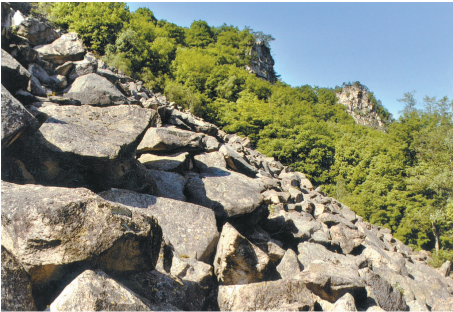
Abb. 3: Blockfeld beim Kirchenwald im Südosten des Nationalparks. Darüber die Abbruchwände im Thaya-Granit.

An der Waitzendorfer Störungszone, die zwischen Pulkau und Znojmo die Böhmisches Masse gegen die Alpin-Karpatische Vortiefe (Molassezone) begrenzt, sind die Gesteine in manchen Bereichen durch laterale, sinistrale (linksseitige) Bewegungen an der Störungszone ebenfalls kataklastisch zerbrochenen und zerrienen.