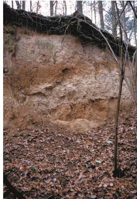
Abb. 7: Löss mit zwei eingelagerten, mittelpleistozänen, fossilen Böden im Trausnitztal (Trausnitzký potok) nordwestlich von Konice.

Durch Frostverwitterung und Frostsprengung wurden besonders in den Kaltzeiten des Pleistozäns die Gesteine im Thayatal geformt und zerstört, aber auch durch Felsstürze aufgrund von Felsentlastung und die damit verbundene gravitative Zerlegung erfolgte eine weitere Gesteinszerlegung. Schutt (Kristallinschutt, Blockschutt) tritt im Thayatal vor allem in Schutt- und Blockfeldern sowie Blockströmen unterhalb von steilen Felswänden und Felstürmen auf. Sie treten bevorzugt im Bereich des primär schon stark geklüfteten und blockig zerfallenden Thaya-