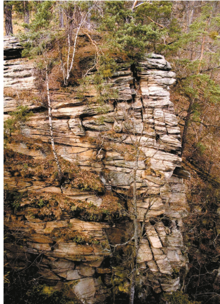
Abb. 5: (a) Glimmerschiefer der Pernegg-Gruppe im Bachbett des Ochsengrabens (links). (b) Turmfelsen im Bittescher Gneis südöstlich vom Stierwiesberg (Býčí hora) (rechts).

Als höchste strukturelle Einheit des Moravikums folgt über der Pernegg-Gruppe die Bittesch-Einheit mit dem Bittescher Gneis als Leitgestein. Dieses Gestein, das