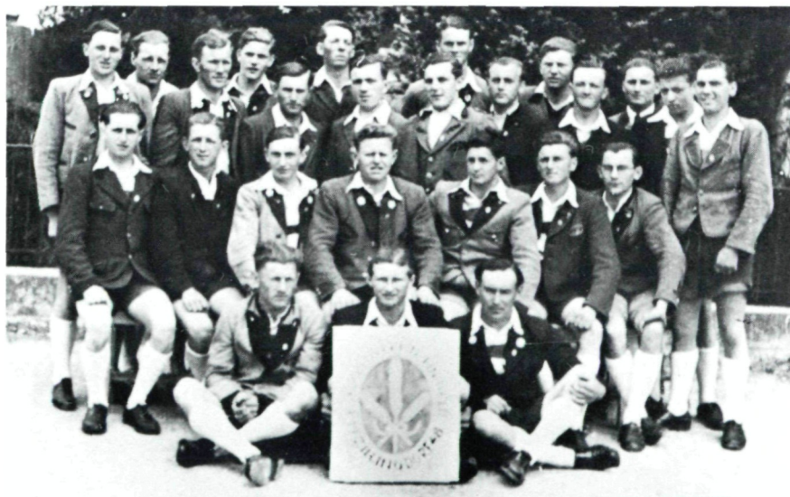
Die „Steirertracht“ der Nachkriegsjahre