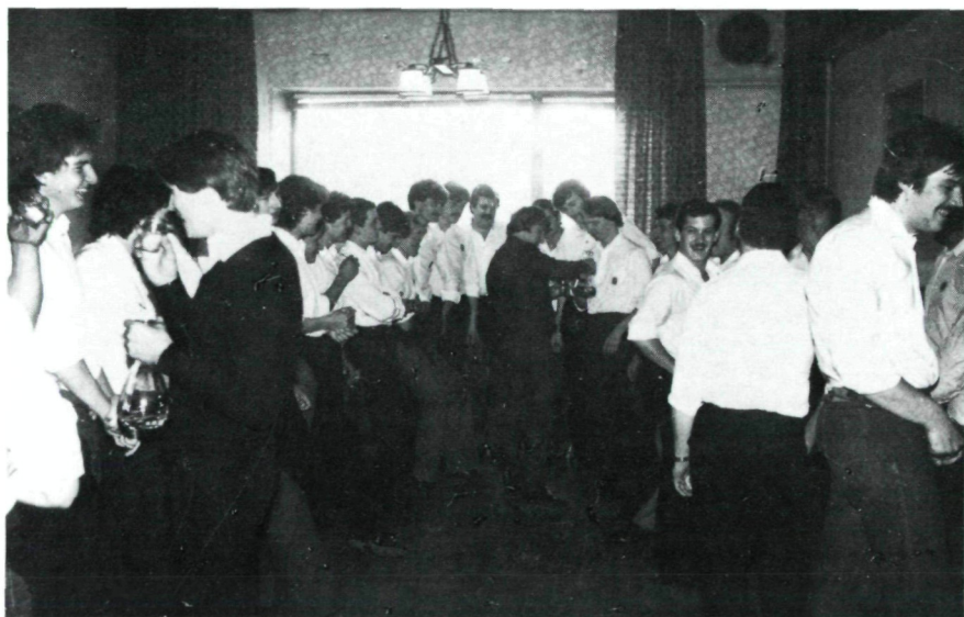
„Einkaufen“ in Lichtenwörth am Fastsonntag 1983