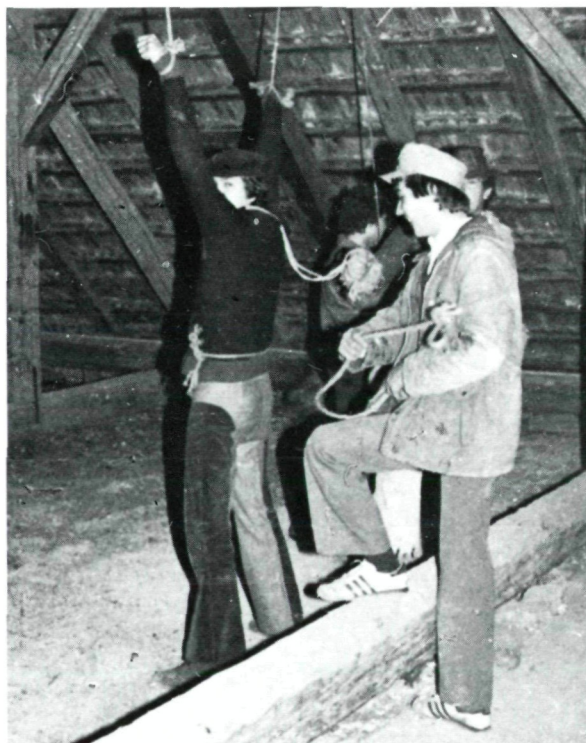
„Burscheneinkaufen“ in Tattendorf am Faschingmontag 1981

lung der Faschingsumzug am Nachmittag des Faschingdienstags, das Eiersammeln und das gemeinsame Eierspeisessen am Aschermittwoch, der Kirtag zu Georgi, der gemeinsame Burschenausflug, der Heurigenausflug mit allen Zillingdorfern, welche beim Faschingszug helfen, und der Silvesterball. Außerdem trifft man sich zwanglos im Vereinslokal, dem Gasthaus „Müllner draußen“ sowie im Gasthaus „Zur Insel“, welches auch dem Burschenclub Eggendorf zu Zusammenkünften dient. (Fortsetzung folgt)