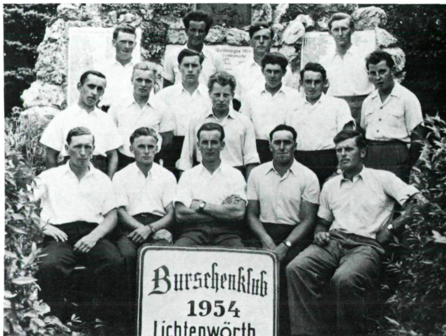
Der Burschenklub „Eintracht“ Lichtenwörth 1954