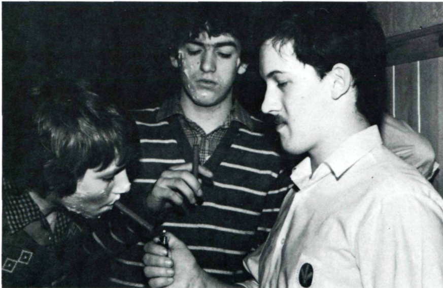
„Einkaufen“ in Lichtenwörth