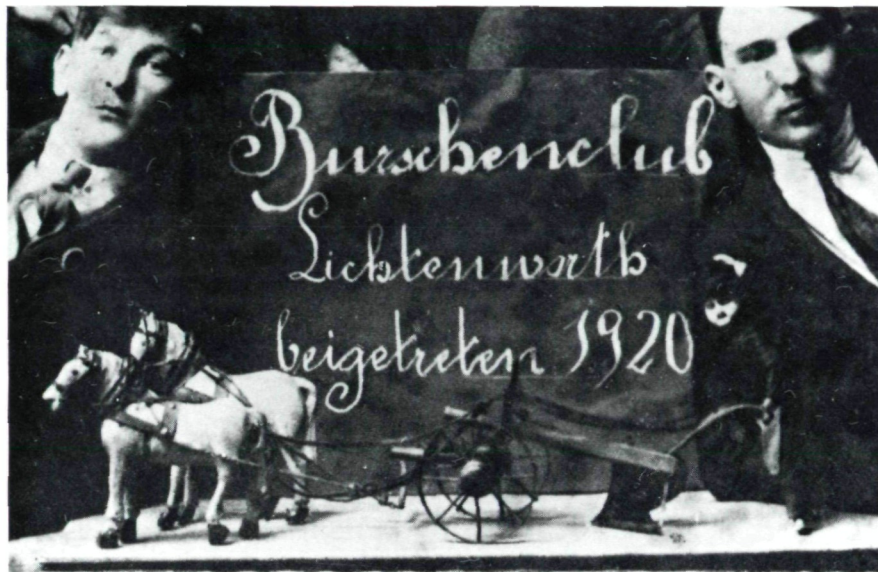
Der „Ackerknecht“ von Lichtenwörth, ein heute verlorengegangenes Symbol, verdeutlicht die Gemeinsamkeiten mit den burgenländischen Burschenschaften