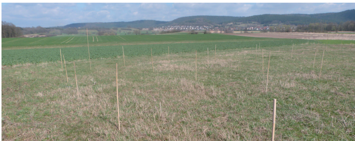
Abb. 5: Die beiden Bilder zeigen frisch ausgebrachte Cluster von Bambusstöcken im Rotmaintal im März 2017.- Both pictures are showing clusters of bamboo perches that were recently output in the Rotmaintal in March 2017.

sen der umgebenden Vegetation die Bedeutung der Warten dann immer geringer. Schon Mitte/Ende Juli ließen sich Flächen mit Bambusstöcken und solche ohne auf den ersten Blick kaum mehr unterscheiden (Abb. 4). Dennoch nutzten die Braunkehlchen, die künstlichen Sitzwarten auch in dieser Phase noch häufig.