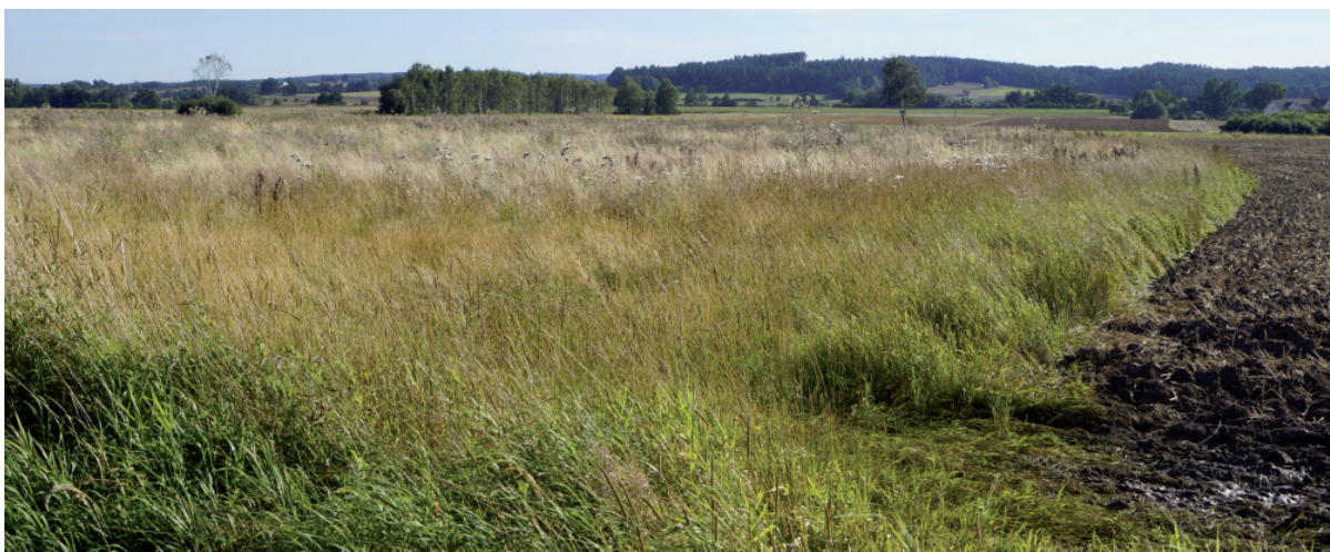
Abb. 4: Die Bedeutung der Bambusstöcke nimmt im Laufe der Brutsaison immer mehr ab. Im Juli sind Flächen mit (oben) und solche ohne (unten) künstliche Warten kaum mehr zu unterscheiden.- The importance of the bamboo piles decreases during the breeding season. In July areas with artificial perches (above) and such without (below) are nearly similar.