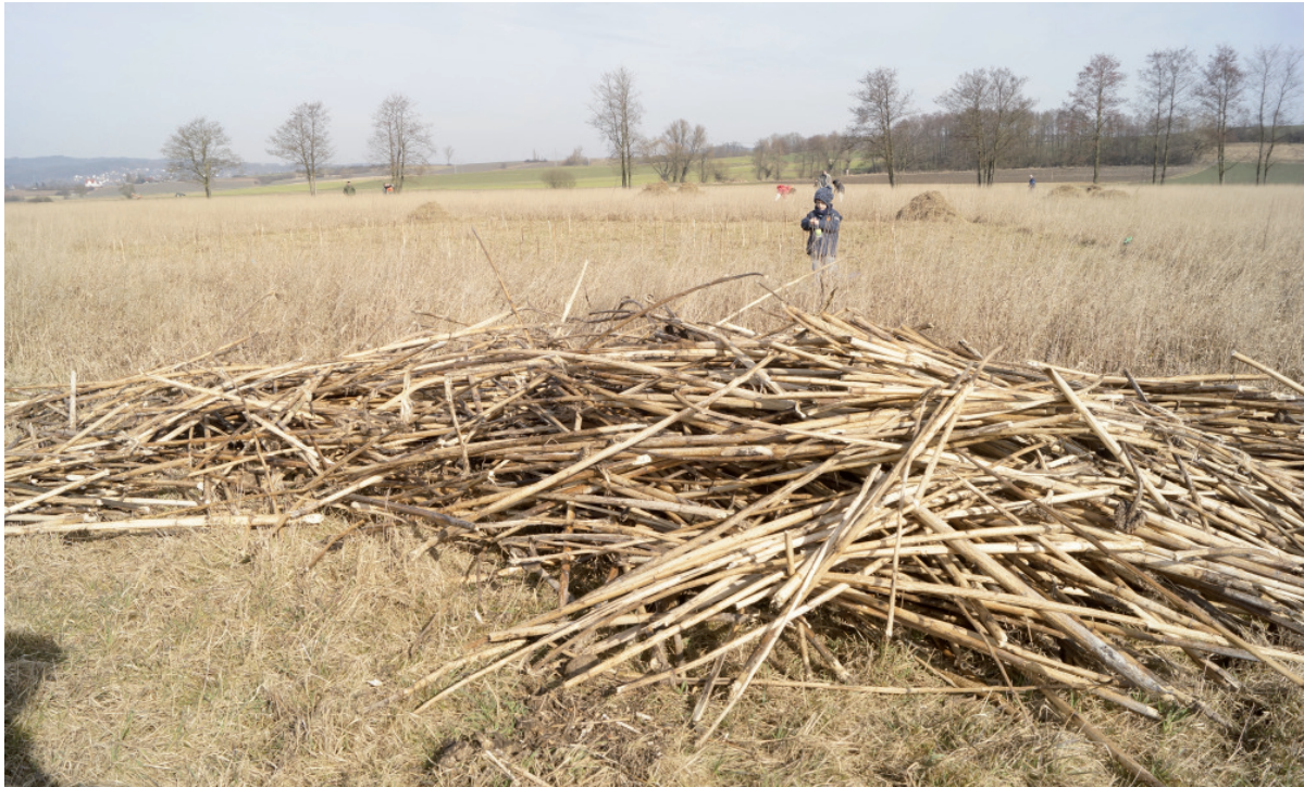
Abb. 2: Im März 2015 brachte die LBV-Kreisgruppe hunderte von alten Sonnenblumenstängeln im Rotmaintal aus. Zuvor wurden in einige der vergrasteten Brachen ‚Fenster‘ gemäht. - In March 2015 members of the LBV first mowed parts of the old fallow land before they distributed hundreds of old sunflower stalks there.

Kulmbach mehr als 30 ha landwirtschaftliche Nutzfläche (vor allem Äcker) aus der Nutzung genommen. Die Populationsentwicklung des Braunkehlchens in den Jahren 2010 - 2014 zeigte aber, dass in diesem Gebiet selbstbegründernde Ackerbrachen meist nur kurzzeitig für die Art attraktiv sind. Auf den Ackerbrachen des Untersuchungsgebietes entwickeln sich häufig bereits nach zwei bis drei Jahren monotone und strukturarme Graslandschaften. Es fehlen u.a. natürliche Strukturen wie z.B. letztjährige Disteln oder Doldenblütler, die als Sitz- und Singwarten dienen können.