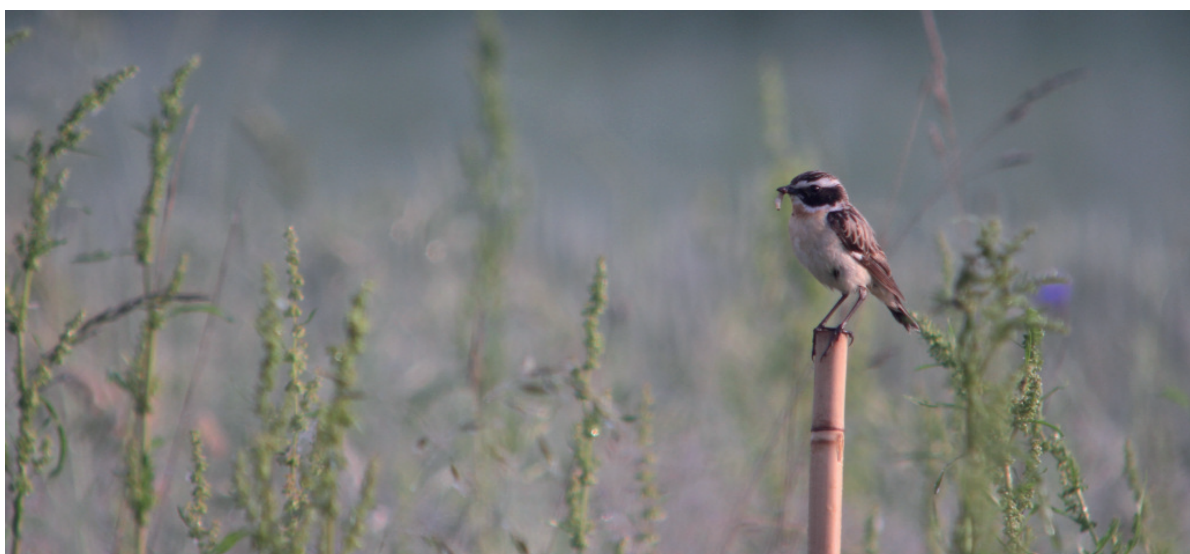
Abb. 1: Nicht selten nutzen die Braunkehlchen die künstlichen Warten sogar als „Nestwarten“ (= nächste Warte zum Nest). - Frequently the Whinchats use the bamboo perches as „nest perches“ (= next perch to the nest).

Schon seit 2010 wurden im Rotmaintal bei