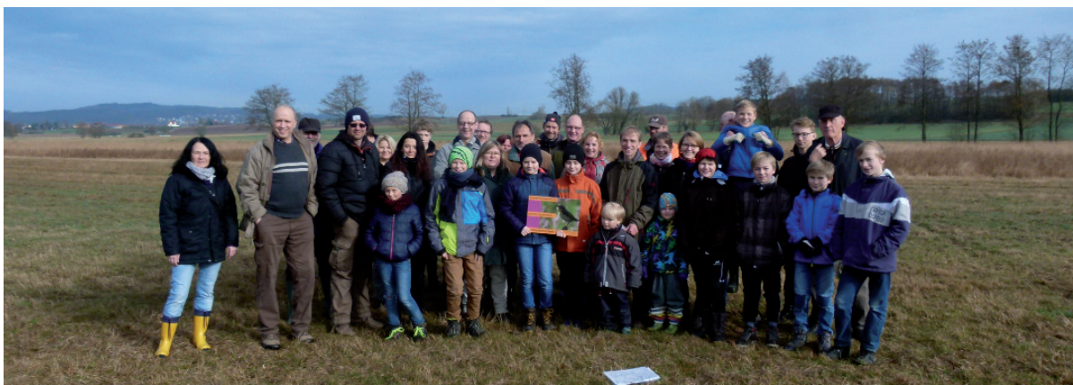
Abb. 6: Das Ausbringen von alten Sonnenblumenstängeln im Frühjahr 2015 erwies sich als zu aufwändig (oben). Im März 2017 brachten mehr als 40 freiwillige Helfer über 2000 Bambusstöcke im Rotmaintal bei Kulmbach aus (unten). - Experiences of 2015 show that the use of old sunflower stalks as perches is impractical (above). More than 40 volunteer helpers distributed over 2000 bamboo sticks in the Rotmaintal near Kulmbach in March 2017 (below) (Photos: © Frank SCHNEIDER (above) / Erich SCHIFFELHOLZ).

behörde weitere Fördermaßnahmen geplant und durchgeführt (u.a. Mahd-Mosaik, Brachestreifen, Entnahme von Gehölzen).