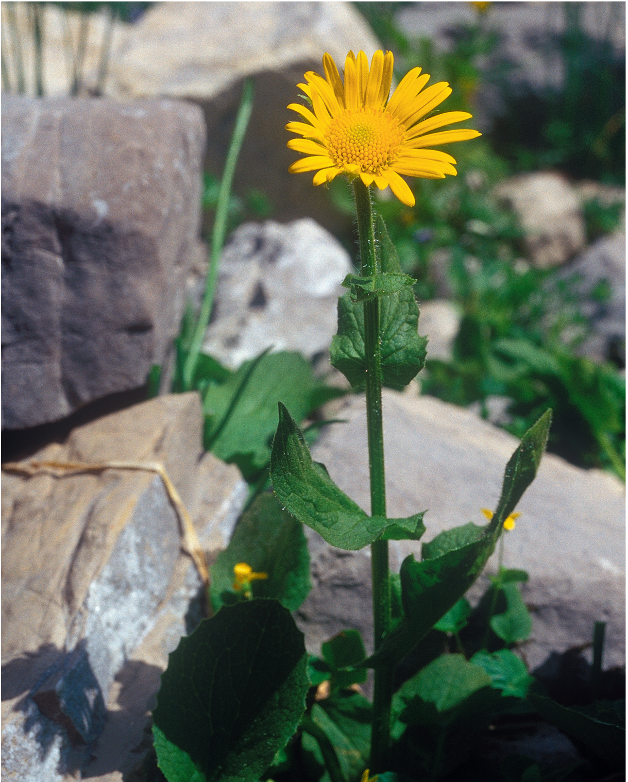
Abb. 1: Der einzig bekannte Wuchsort der Großblütigen Gämswurz ( Doronicum grandiflorum ) liegt im Mangfallgebirge (Bayern und Tirol) am Hinteren Sonnwendjoch in 1690 m Höhe (28. Juli 2008).