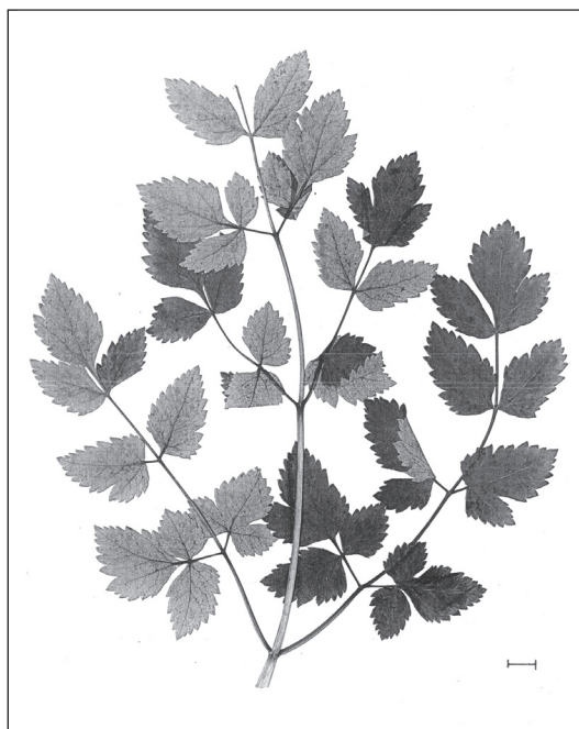
Abb. 5: Nur in der Grundachenschlucht wächst im Mangfallgebirge der Quirl-Haarstrang ( Peucedanum verticillare ). Der Beleg dieses in Bayern bisher noch nicht nachgewiesenen Doldenblütlers wurde am 2. Juni 1998 am Steig vom Wirtshaus Valepp zur Erzherzog-Johann-Klause gefunden.

Petasites paradoxus , Alpen-Pestwurz, P: 2 8337/34 Grundachenschlucht 940 m, 2008; 8337/43 Kalk- schutt oberhalb Grundalm 1982; 8338/33 Böschung auf der Ascherjoch-Westseite 880 m, 2007; 8436/14 Köglboden 960 m, 2008; 8436/21 Halserspitz-Südseite 1630 m, 2008; 8436/23 Ampelsbachtal 1000 m, 2008; 8437/12 Grundachen- schlucht 870 m, 1998