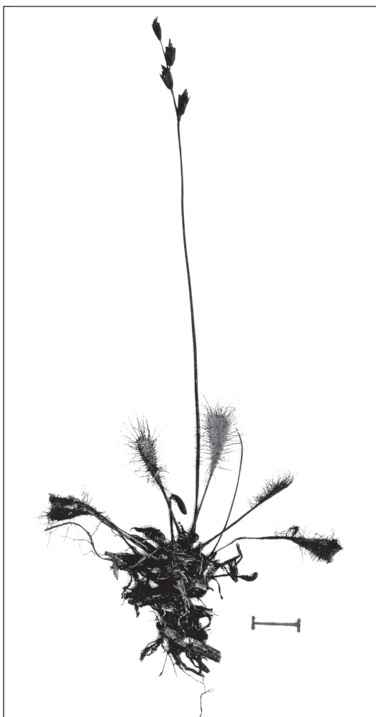
Abb. 4: Der Bastard-Sonnentau ( Drosera xobovata = Dr. rotundifolia × Dr. anglica ), gesammelt am 11. August 2008 in einem Moor westlich von der Blaubergalm, wird immer wieder mit dem Mittleren Sonnentau ( Drosera intermedia ) verwechselt. Bei letzterem entspringt jedoch der Blütenstand seitlich der Blattrosette, steigt bogig auf und ist nur wenig länger als die Blätter.

Drosera xobovata , Bastard-Sonnentau, P: 0 8436/12 Moor westlich Blaubergalm 1280 m, 2008 H; 8436/22 Moor im Wildalmkessel 1435 m, 2008 H; 8437/21 Moor auf der Ackernalm 1340 m, 2008 Es ist zu überprüfen, ob es sich bei dem von G. EBERLE (2007: 509) aus dem Wildalmkessel angeführten Mittleren Sonnen- tau ( Drosera intermedia ) nicht ebenfalls um diesen Bastard handelt.