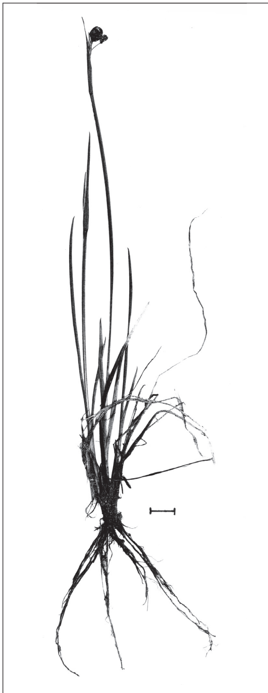
Abb. 6: Zu den Arten, die erst im 20. Jahrhundert im Gebiet auftauchten, gehört das Schmalblättrige Blauaugengras ( Sisyrinchium bermudiana ). Die Abbildung zeigt eine von siebzig Pflanzen, die im Mai 2008 auf feuchtem, wenig bewachsenem Boden bei Thiersee-Wachtl zum Blühen kamen.

Silene nutans , Nickendes Leimkraut, P: 0 8337/44 Wildenkarjoch 1745 m, 1997; 8436/12 Blaubergalm 1540 m, 2008; 8436/21 Halserspitz-Westrücken 1805 m, 2008; 8437/21 Böschung auf der Steinkaseralm 1500 m, 2008; 8437/22 Böschung unterhalb Wildenkaralm 1320 m, 2008; 8437/24 Veitsberg 1785 m, 2008