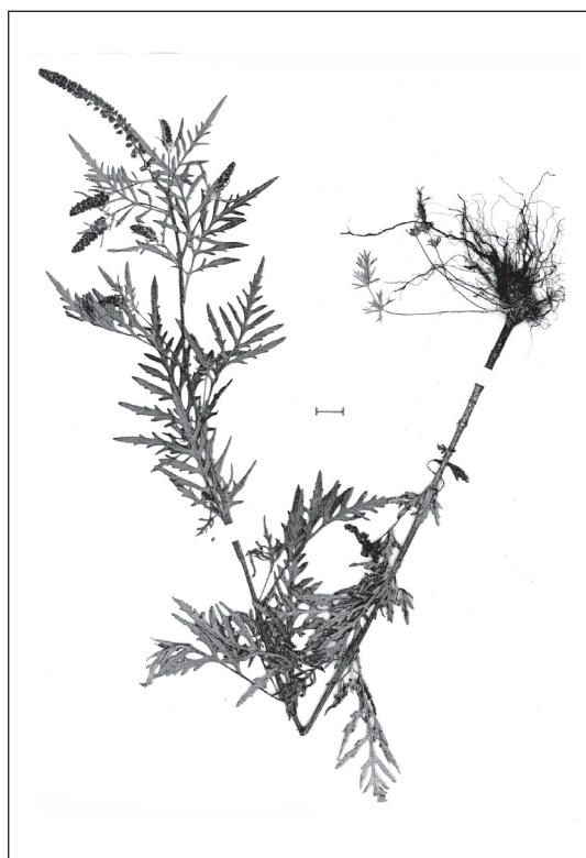
Abb. 3: Wenig Freude macht Allergikern, dass sich das aus Nordamerika stammende Beifußblättrige Traubenkraut (Hohe Ambrosie = Ambrosia artemisiifolia ) in den letzten Jahrzehnten auch in Tirol einbürgert. Die abgebildete Pflanze fand sich am 10. August 2008 noch wachsend in Achenwald. Der Maßstab entspricht einem Zentimeter.

Ambrosia artemisiifolia , Beifußblättriges Traubenkraut, P: 0 8436/13 ruderal in Achenwald 840 m, 2008 H