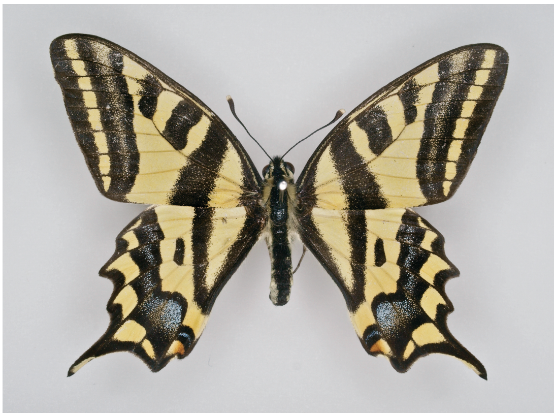
Abb. 5: Südlicher Schwalbenschwanz ( Papilio alexanor ) in einer von J. Nel beschriebenen Unterart, Foto Heim, TLM.

Papilio alexanor desteliensis NEL & CHAULIAC, 1983