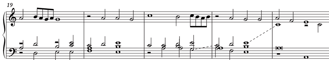
Abb. 4: Miserere mei Deus , secunda pars, Takte 19–23, Praktische Ausgabe. Aus: Novak, Manfred (Hg.): The Organ Tablature from Klagenfurt , ms. GV 4/3. Transcription, Commentary & Facsimile, 3 Bde, Zabrze 2009, Bd. 3: Practical Edition, S. 23.

Ob zumindest einer dieser drei Drucke jedoch tatsächlich als Vorlage für den unbekanntem Intavolator des Klagenfurter Manuskripts gedient hat, muss als fraglich gelten. Die rhythmischen Unterschiede sind zu zahlreich und teilweise zu auffällig, um als unbedeutend gelten zu können, zumal der Intavolator keinerlei Anstrengungen unternahm, um die Musik der Ausführung auf einem Tasteninstrument anzupassen, sondern akribisch genau der polyphonen Struktur folgte, und die Textdeklamation als Anlass für rhythmische Veränderung bei instrumentaler Ausführung wegfällt. Neben für den Intavolierungsprozess typischen Versehen wie Oktav- oder Terzfehlern findet man auch tatsächlich unterschiedliche Lesarten (siehe Abb. 4)