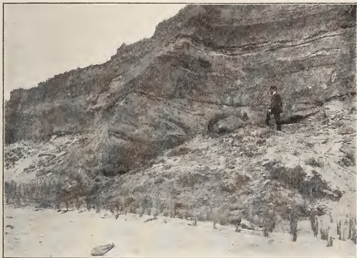
Fig. 2. Rotes Kliff auf Sylt, 50 m südlich Bühne IX.

unverkennbarster Moränennatur, kratziger Beschaffenheit und zahlreichen Geschieben. Die Faltung der gebankten untersten Moräne ist dieselbe wie die der darüberliegenden Diluvial- sande, so daß von „Unterfassen“, „Unterschieben“, „Apophysen“, „Einfaltung“ der Hauptmoräne gar keine Rede sein kann. Zu Fig. 8 von PETERSEN möchte ich die damals aufgenommene Skizze (Fig. 1) auf S. 82 beifügen.