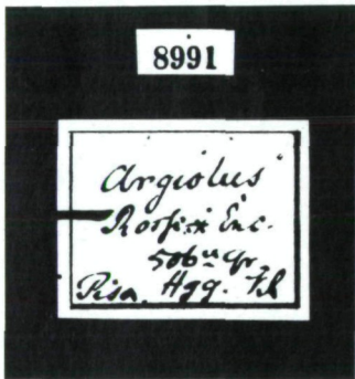
Abb. 7: Alte Etiketten des Lectotypus von Latibulus argiolus .