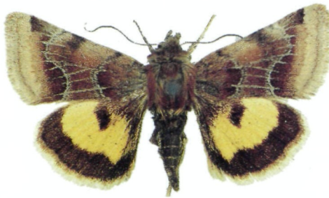
Abb. 3. Pyrocleptria cora EVERSMANN, ♂.