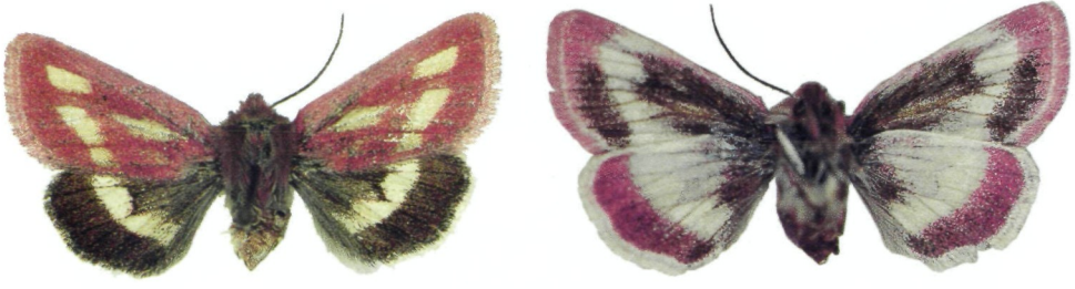
Abb. 1, 2. Pyrocleptria naumanni sp. n. ♂, Holotypus, rechts Unterseite.