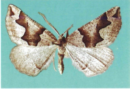
Abb. 1: Artemidora vartianae sp. n., ♂ aus Paghman.

Verbreitung: Afghanistan bis NW-Pakistan in Höhen zwischen 1500 und 2500m.