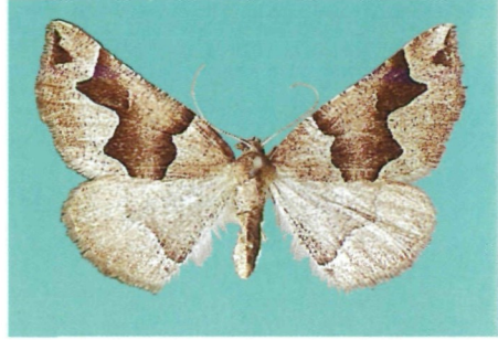
Abb. 2: Artemidora vartianae sp. n., ♀ aus Paghman.