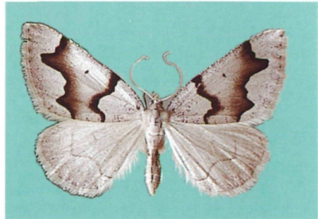
Abb. 6: Anonychia rostrifera WARREN, 1888, ♀ aus Pakistan.