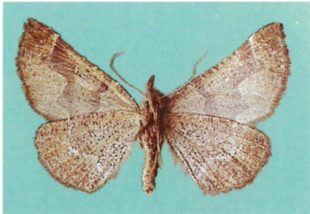
Abb. 5: Artemidora vartianae sp. n., ♂ Unterseite.