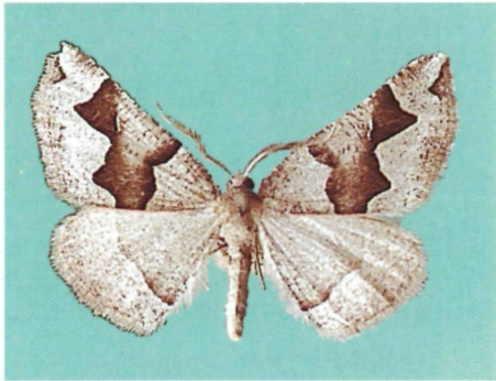
Abb. 3: Artemidora vartianae sp. n., ♂ aus Kotkai.