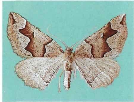
Abb. 4: Artemidora vartianae sp. n., ♀ aus Kotkai.