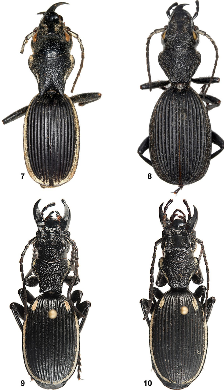
Abb. 7 - 10: Habitus: (7) Anthia (Odontanthia) calida , ♂, Lectotypus, Körperlänge 37 mm, Lunda, Pogge, in coll. Museum für Naturkunde Berlin; (8) Anthia (Odontanthia) calida , ♀, Körperlänge 34 mm; Mayidi, 1942, Rév. P. Van Eyen, in coll. Africa-Museum Tervuren; (9) Anthia (Odontanthia) convexipennis , ♂, Viamba; (10) Anthia (Odontanthia) convexipennis , ♀, Viamba (Fotos: 7: F. Kleinfeld 2013; 8: F. Kleinfeld 2011; 9, 10: M. Wieland 2013).