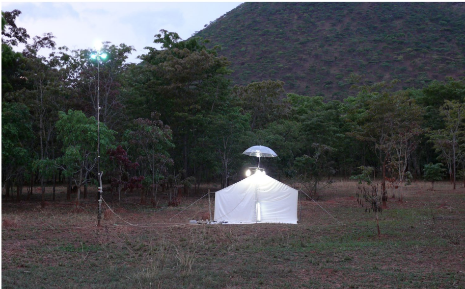
Abb. 1 - 2: (1) Baum-/Buschsavanne des Hochplateaus von Huila in der Umgebung von Nova Monção. Habitat von Anthia (Odontanthia) kleinfeldi sp.n. (2) Leuchtplatz in der Baum-/Buschsavanne des Hochplateaus von Huila in der Umgebung von Negola. Habitat von Anthia (Odontanthia) convexipennis PUTZEYS, 1880 (Fotos: A. Puchner, November 2012).