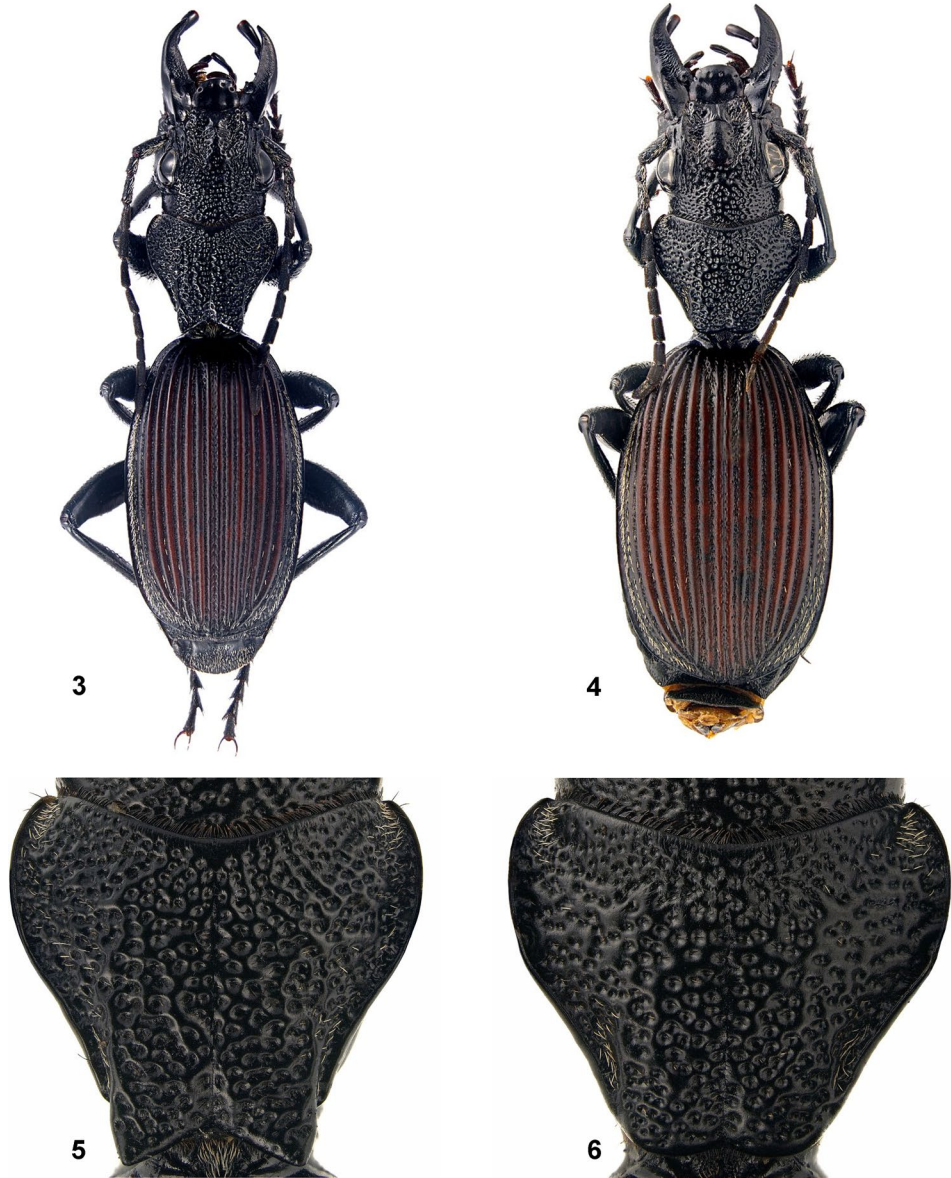
Abb. 3 - 6: Habitus und Halsschilde von Anthia (Odontanthia) kleinfeldi sp.n.: (3, 5) Holotypus, ♂, Nova Monção; (4, 6) Paratypus, ♀, Nova Monção.

coll. Schüle (Herrenberg, D); 1 ♂, Angola, 7.XI.2011, 50 km N Caconda, Huila Prov., G. Werner leg., in coll. Werner (Peiting, D); 2 ♂♂, 8.XI-2011 Angola Huambo, Province 75km N Caconda, nr. Cuima, P. Schüle leg., in coll. Schüle (Herrenberg, D); 1 ♂, gleiche Daten, in coll. Puchner (Grafenbach, A); 1 ♂, Angola; Huila Prov.; 75 km N Kaconda; 13°24'S, 15°28'E, 7.11.2011; sandy forest 1643m, leg Ruth Müller, coll. Ditsong Museum (Transvaal Museum); 2 ♂♂, Angola; Huila