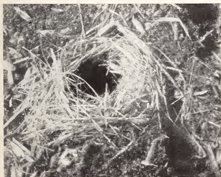
Abb. 2: Bodennest (Winternest) der Zwergmaus unter einem am Erdboden liegenden Brett (Freilandaufnahme). Die Nestmulde sowie die rechts oben und unten erkennbaren Eingänge sind in das lockere Erdreich gegraben.