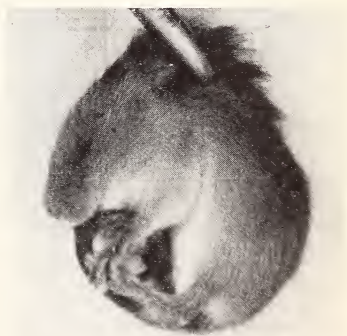
Abb. 3: Zwergmaus-Nestling (8 Tage alt) in „Tragstarre“ von einer Pinzette angehoben. Man beachte den eingerollten Schwanz und die angezogenen Beine.