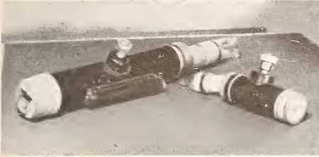
Abb. 1: Künstliche Vaginen für die Wiederkäuer.

Zu J. Huhn: Methode und Probleme der Samenübertragung bei Haussäugetieren.