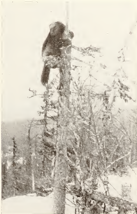
Abb. 1: Ein junger Vielfraßröde in seinem Biotop (Ålvdalen, Svartåsen, Oktober 1955).

Zu P. Krott: Das heutige Vorkommen des Vielfraßes ( Gulo gulo L.) in Europa.