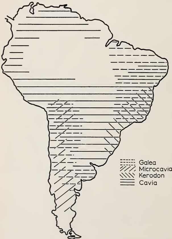
Abb. 1. Verbreitung der Gattungen Galea , Microcavia , Kerodon und Cavia

Der älteste Name ist Mus porcellus Linnaeus 1758. Alle anderen sind als Synonyme zu behandeln. Wenn das Hausmeerschweinchen eine selbständige Art wäre, hieße es demnach Cavia porcellus (Linnaeus) 1758. Das Hausmeerschweinchen ist jedoch eine domestizierte Tierform, die aus einer wilden Stammart hervorgegangen ist. Da aber eine nomenklatorische Trennung der Haustiere von ihren Stammarten, die im allgemeinen heute bekannt sind (HERRE, 1958), dem derzeitigen wissenschaftlichen Kenntnisstand nicht entspräche, schlug BOHLKEN (1958, 1961) vor, die Hausform