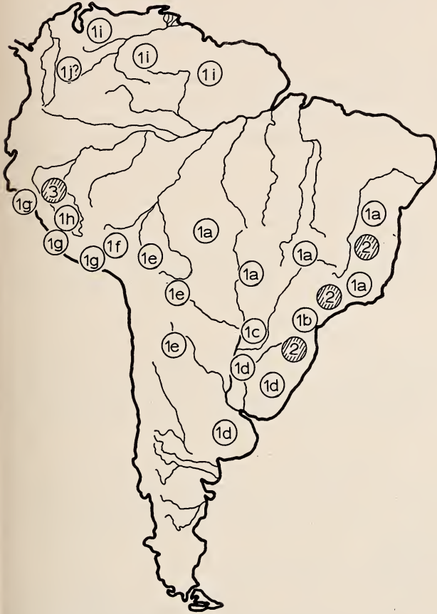
Abb. 2. Verbreitung der Arten und Unterarten der Gattung Cavia

den natürlichen Gegebenheiten entsprechend, nomenklatorisch wie eine polytope Unterart der Wildform zu behandeln (vergl. HERRE, 1961). Gegen diese Auffassung sind Einwände erhoben worden (FELTEN, 1960), weil Nomenklaturgebräuche nicht