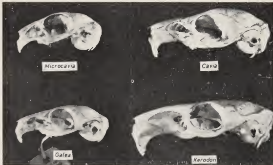
Abb. 1. Schädel von Microcavia australis , Cavia aperea , Galea musteloides und Kerodon rupestris

Innerhalb dieser Unterfamilie werden die Gattungen Microcavia GERVAIS & AMEGHINO 1880, Galea MEYEN 1831, Cavia PALLAS 1766 und Kerodon CUVIER 1825 unterschieden (Abb. 1).