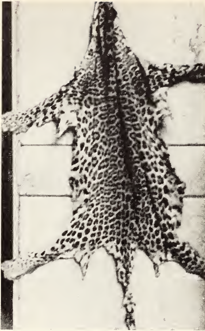
Abb. 3. Fell aus Dikschu in Südsikkim, Nr. 91054 aus dem Zool. Mus. Berlin. (Aufn.: L. J. DOBRORUKA)

Ich konnte auch einige Felle studieren. Im Zoologischen Museum in Berlin befinden sich zwei Felle dieser Rasse. Ein ♀-Fell stammt aus Siam und stimmt im Muster mit dem oben erwähnten Prager Weibchen überein. In der Farbe ist es „aurantico-flavus 9/9 – 10/10“ nach RABKIN („orange“ bis „cadmium orange“ nach RIDGWAY). Das Haar ist 2 cm lang. Das zweite Fell, Nr. 91 054, ohne Geschlechtsangabe, stammt aus Dikschu in Südsikkim. Die Farbe ist mehr braun, etwa „aurantiaco-flavus 8/12“ nach RABKIN (d. h. „raw sienna“ nach RIDGWAY). Das Haar ist 2 cm lang (Abb. 3). Durch den Pelzhandel sind im Jahre 1960–61 einige solcher Leoparden-Felle aus Südchina nach Prag gekommen, die ich auch untersuchen konnte. Der Durchschnitt der 7 Felle zeigt eine Haarlänge von 1,5 cm; die Farbe variiert von „aurantiaco-flavus 9/11“ (= „mars yellow“) bis „aurantiacus 8/10“ (= „orange rufous“). Alle untersuchten Tiere sind ziemlich klein und kurzbeinig. Wenn ich das Bild des „Ganges-Leoparden“ aus HECK „Lebende Bilder aus dem Reiche der Tiere“ (1899) vor mir habe, neige ich dazu, auch dieses Tier zu diesen Leoparden zu rechnen. Außerdem habe ich auch einige schwarze hinterindische Leoparden gesehen, da bei dieser Form die melanistischen Formen häufig vorkommen.