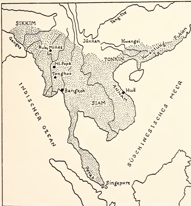
Abb. 4. Verbreitungskarte von P. p. sinensis , BRASS, 1911

1 Fundort — 2 Gesamtschädelänge — 3 Condylbasallänge — 4 Basallänge — 5 Jochbogenbreite — 6 Gehirnschädelbreite — 7 Interorbitalbreite — 8 Postorbital- breite — 9 Länge des oberen P 4 — V Variationsbreite — N Individuenzahl — D Durchschnittswert