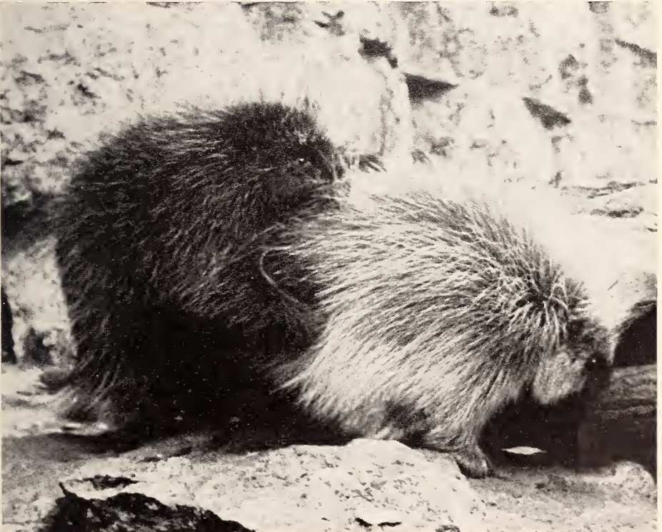
Abb. 3. Das ♂ versucht, beim ♀ aufzureiten und zieht das ♀ mit den Vorderpfoten zu sich heran. Aufnahme W. GRUMMT, 18. IX. 1962

Händen zu halten. Auch ♀ 2 wird aus einiger Entfernung beharnt. ♀ 2 richtet sich aber seinerseits auf und droht, wobei es unter „hääui“-Rufen auf das ♂ zufährt, daß es zurückweicht. Dann wendet sich das ♂ wieder ♀ 1 zu und bespritzt es hoch aufgerichtet abermals, das sich aber jeder weiteren Annäherung dadurch entzieht, daß es in einen hohlen Baumstamm kriecht. Sofort wendet sich das ♂ wieder ♀ 2 zu, das sich abweh-