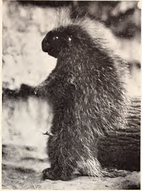
Abb. 6. Es erfolgt aus dem vollerrigierten Penis heraus der Harnstoß. Man beachte die Sitzhaltung des ♂, aber auch das abstehende, aufgelockerte Haar seines Rückens. Aufnahme G. BUDICH, 18. XI. 1962