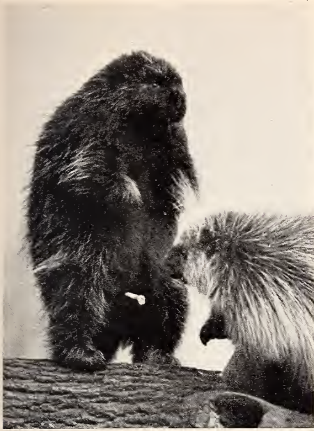
Abb. 5. Das ♂ kurz vor dem Harnstoß. Der Penis ist zu einem guten Teil erigiert, man sieht sogar im Mittelpunkt das Epistom. Das ♀ widersetzt sich. Aufnahme G. BUDICH, 18. XI. 1962