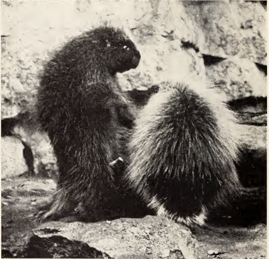
Abb. 1. Urson-♀ wird vom ♂ von der Seite her benäßt. Man beachte die herausgedrückten Augen, das gesträubte Haar und das durchgedrückte Rückgrat des ♂. 18. IX. 1962

weiter und schießt in Abständen immer wieder einen kurzen Harnstrahl. Bei jedem Spritzer quillt der Sacculus urethralis ruckartig heraus, um ebensoschnell wieder zu verschwinden. Hier tritt also der Sacculus urethralis schon eher in Funktion, als ich es seinerzeit (1937) bei Dasyprocta beschrieb, wo ein Ausstülpen des Penisblindsackes und damit eine Vollerektion erst innerhalb der Vagina des ♀ eintrat. Besser paßt der Eindruck beim Urson zu dem, was ich damals bei einem masturbierenden Aguti-♂ sah und beschrieb. Unser Urson-♂ spritzte immer wieder. Aber allmählich wurde die ausgestoßene Harnmenge zusehends geringer. Dann liefen die Tiere für eine kleine Weile auseinander. 9.30 Uhr wiederholt sich der Vorgang. Das ♀ zieht den Kopf etwas ein und wird vom aufgerichteten ♂, das übrigens die kleinen Augen stark herausdrückt, von der Seite benäßt (Abb. 1). Unmittelbar nach dem Harnspritzen erschlafft