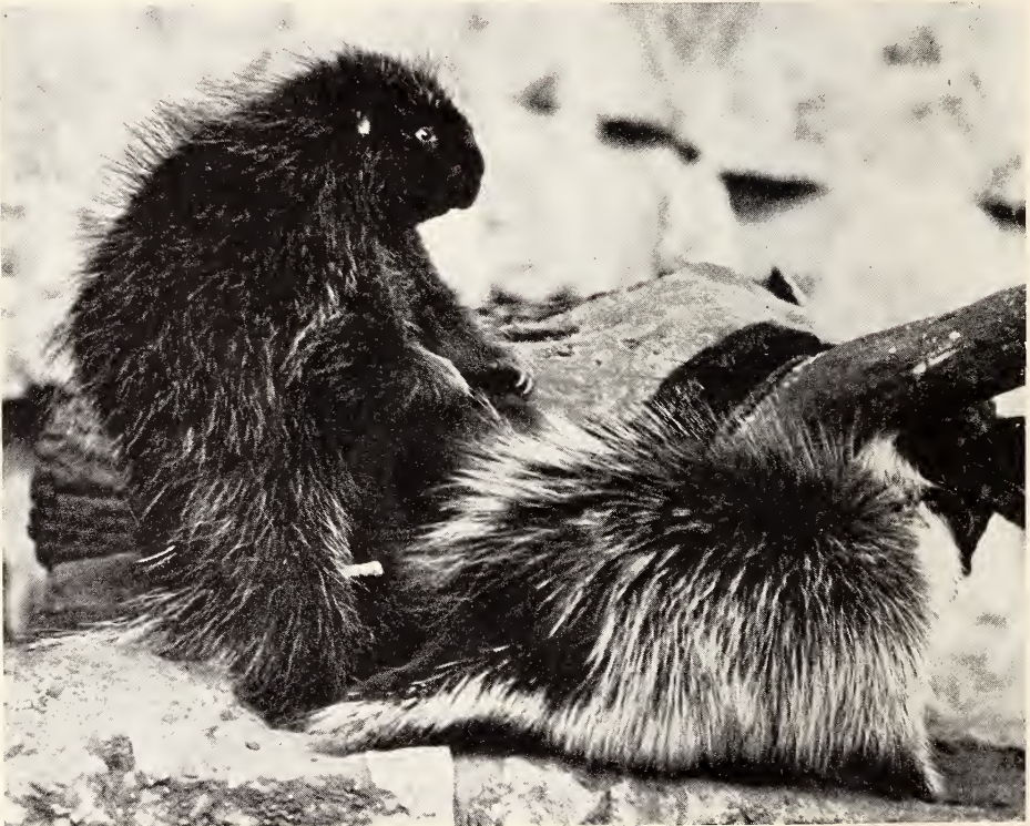
Abb. 4. ♂ richtet sich auf, um das ♀ von hinten zu beharnen. Aufnahme G. BUDICH, 4. XI. 1962

In unserem Falle trat das diskutierte Verhalten bei der Begrüßung neuer Artgenossen auf, wurde aber in gleicher Form auch noch acht Wochen später geübt, als die