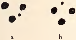
Variante a und b der Wurzeln von M^3 der Waldmaus. Rechte Seite.

Bei Überprüfung einer größeren Anzahl Schädel von Mäusen der Gattung Apodemus KAUP ließ sich feststellen, daß zwei Varianten von M^3 , die außer den normalen drei starken Wurzeln noch je eine zusätzliche feine Wurzel aufweisen, in verschiedenen Gegenden mit geringen Prozentsätzen regelmäßig bei den zwei Untergattungen Sylvaeomys und Apodemus auftreten. Die Alveolen-Bilder beider Varianten zeigen entweder an der Innenseite der drei typischen Wurzeln (a) oder an ihrer Vorderseite (b) diese zusätzliche 4. Wurzel (s. Abb.). Beide genannten Varianten habe ich schon früher nachgewiesen (1955 und 1956). Bei der ostasiatischen Untergattung Alsomys kommt offenbar nur die Variante b vor 1 .