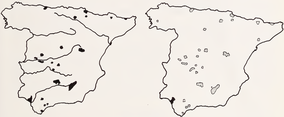
Fig. 2. Distribution du daim ( Dama dama ) en Espagne