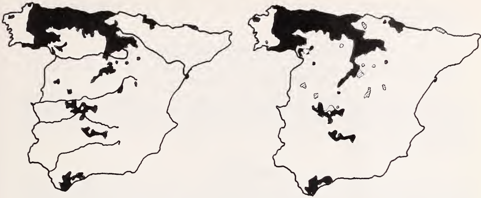
Fig. 1. Distribution du chevreuil ( Capreolus capreolus ) en Espagne