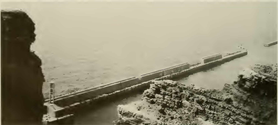
Abb. 1: Nordmole von Helgoland mit rastenden Silbermöwen ( Larus argentatus ). Aufnahme 21.8.1968.