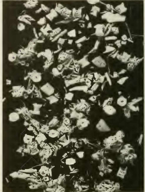
Abb. 2: Silbermöwen-Speiballen aus Fischwirbeln, zerbrochenen Otolithen von Merlangius merlangus und Gräten bestehend. Helgoland-Nordmole, 21.8.1968. Vergrößerung 1,3 fach.