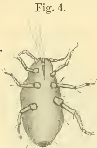
Fig. 4. Aspetto generale del Tetranychus longirostris , visto dal ventre.

Corpo ellissoidale, ristretto anteriormente. Due lunghissime setole, sottili, si trovano all' apice frontale. I palpi liberi, lunghi, presentano 6 articoli disuguali: i primi 2 uguali fra loro, il 3° più lungo di tutti e i rimanenti uguali; il 6° articolo termina con un mammelloncino e un ciuffettino di piccole setole. Ogni articolazione è provvista di 2 breve setole. L'animale presenta un lunghissimo e caratteristico rostro, suddiviso in 6 articoli da solchi trasversi; la forma degli articoli è varia, il 3° è sferoide, il 1° lungo e l'ultimo a forma d'unghia e terminante a punta. Un ciuffettino di setoline si riscontra tutto intorno all' apice del rostro. Le mandibole sono rappresentate da due lunghi e flessibili stiletti, che si trovano anteriormente e basilarmente al rostro. Mancano setole lunghe scapolari; solo piccole setole si riscontrano posteriormente e longitudinalmente al corpo dell' animale.