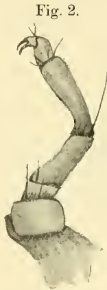
Fig. 2. Zampa del Stigmaeus simrothi .

animale vivo, mi ha fatto vedere l'uscita dal rostro dei granuli clorofillari, di cui l'acaro n'era pieno.