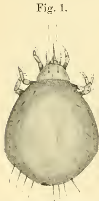
Fig. 1. Stigmaeus simrothi , aspetto generale visto dal dorso.

Grossi sacchi ciechi al numero di quattro paia, laterali e posteriormente, vanno a fondersi nella linea mediana, e costituiscono nella loro fusione il canale digerente, il quale sbocca, posteriormente e medianamente, con l'apertura anale. Una lieve compressione esercitata sull'