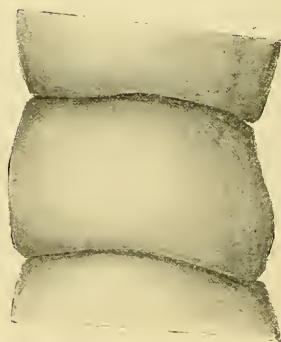
Fig. 3. B. andresi : quinto tratto (leggermente campanulate) ( \times 33 ).