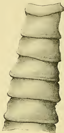
Fig. 1. Bothriocephalus andresi : scolice e primo tratto delle proglottidi ( \times 33 ).