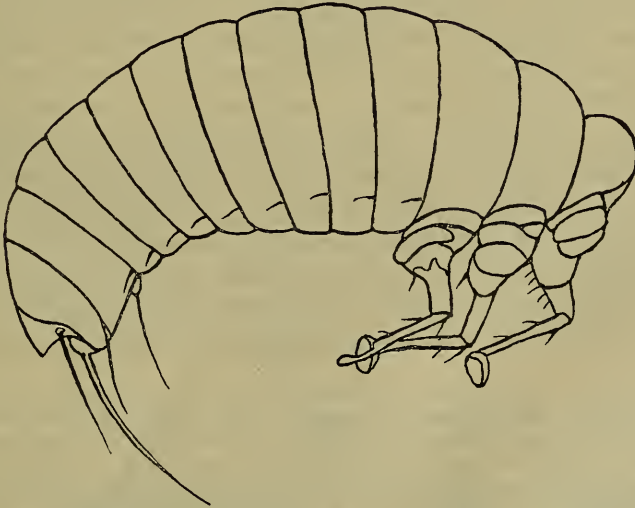
Fig. 3. Mißgebildete Triunguliniform von Eupathocera sphecidarum Duf. a Ventralansicht, b Seitenansicht. Vergrößerung 416 fach.