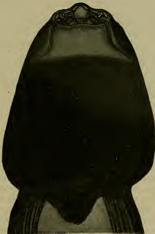
Fig. 1. Cephalothorax des Weibchens von Xenos Bohlsi n. sp. Vergrößerung 40 fach.

Größe des gesamten Tieres etwa 1,2 mm, Längendurchmesser des Cephalothorax 1,94 mm; größter Querdurchmesser 1,62 mm. Der Abstand beider Cephalothoracalstigmen, von einem äußeren Rand zum andern gerechnet, beträgt eine Idee weniger als die größte Breite des Kopfbruststückes. Größe der Brutkanalöffnung 0,46 mm. Seine Entfernung vom apicalen Pol 0,18 mm. Anzahl der Brutschläuche vier. Ventralwärts ist der größere Teil des Cephalothorax schwarz gefärbt, in der Längsachse steigt die Schwarzfärbung bis etwas über die hintere Grenze des dritten Drittels. Der übrige Teil der Ventralfläche ist, bis auf die Seitenränder, die ebenfalls schwarz sind, hellbraun gefärbt, ebenso die dorsale Seite. Der Cephalothorax ist ein sehr dünnes, dorsal stark ausgehöhltes Gebilde. Über die Konfiguration des vorderen Teiles gibt die Figur am besten