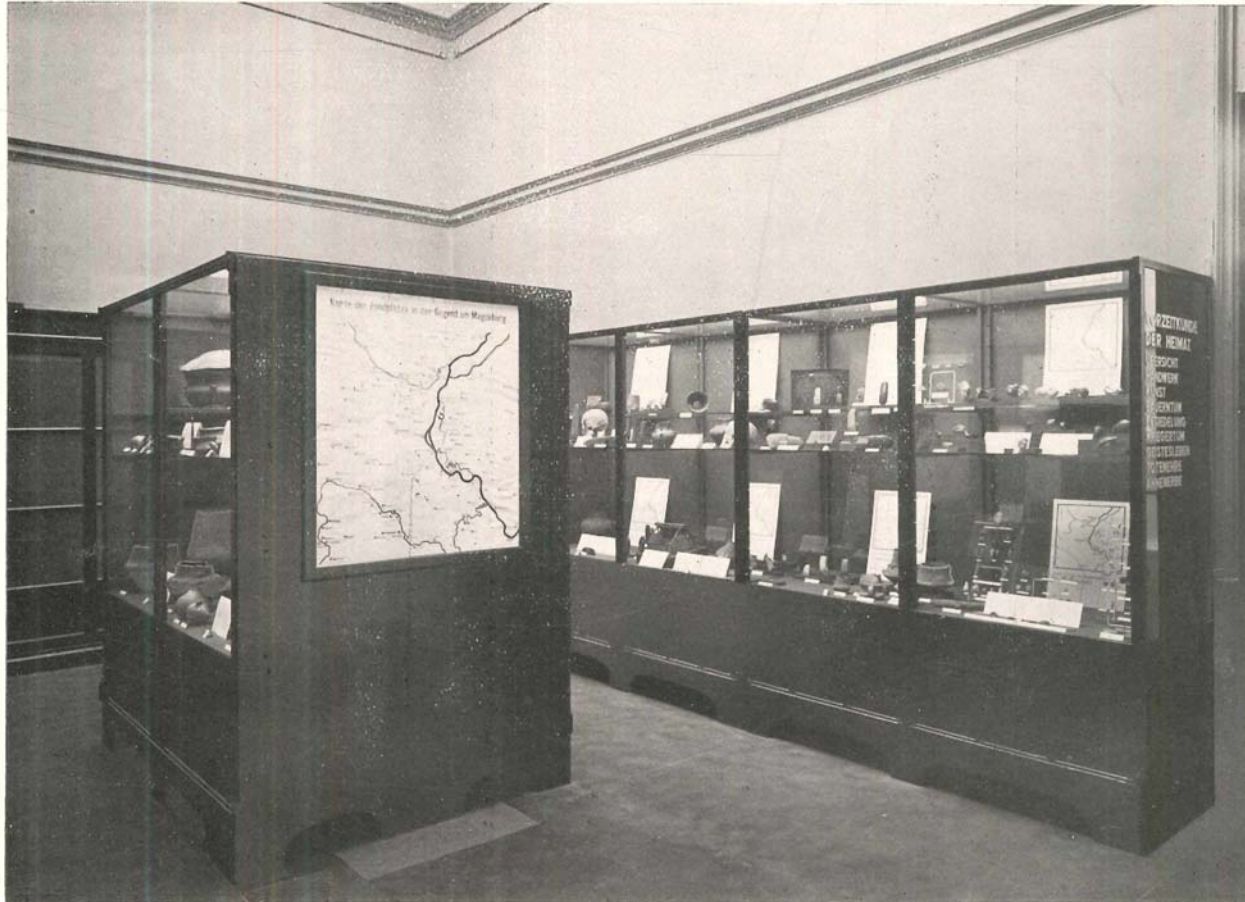
Raum: Besiedlung unserer Heimat in der Vorzeit.