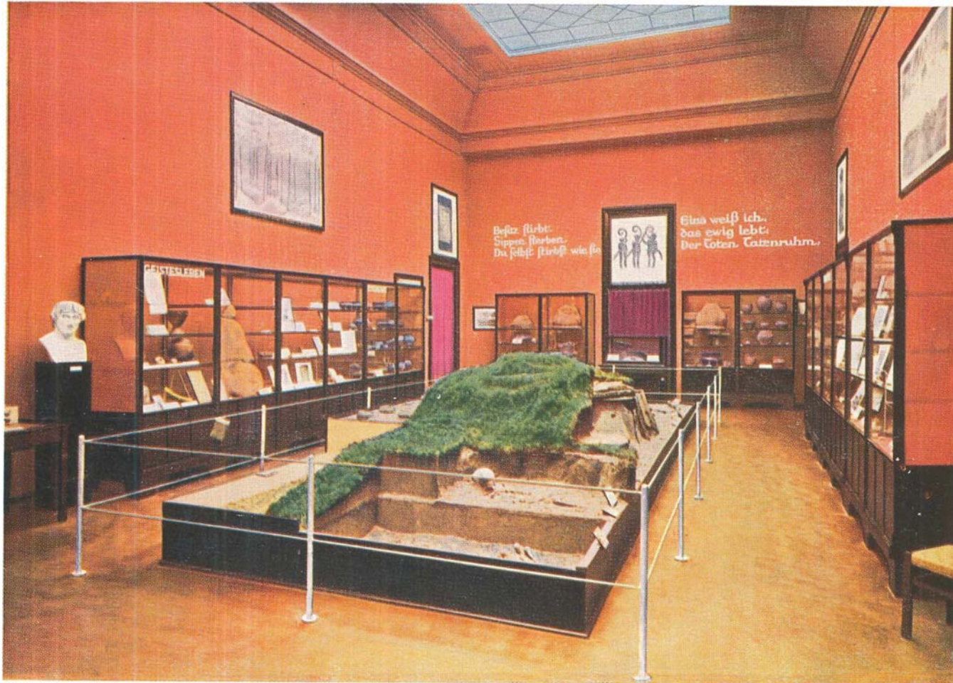
Besiedlung, Kriegertum, Totenehre, geistiges Leben, Ahnenerbe.