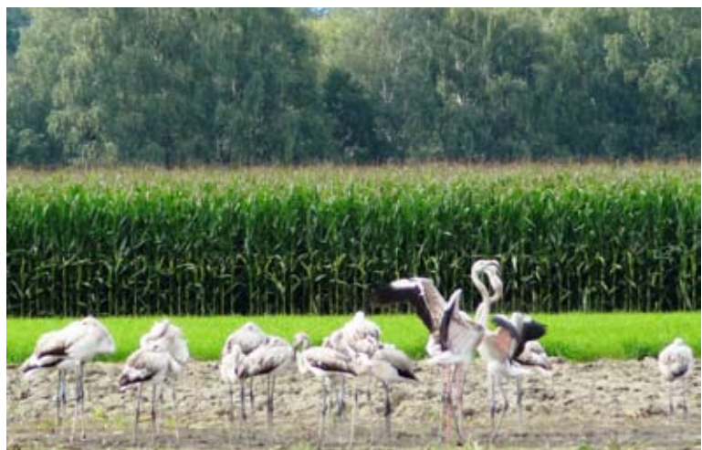
Rosaflamingos bei ihrer Rast in Meiningen: Nur der Altvogel weist die typische Rosafärbung auf.