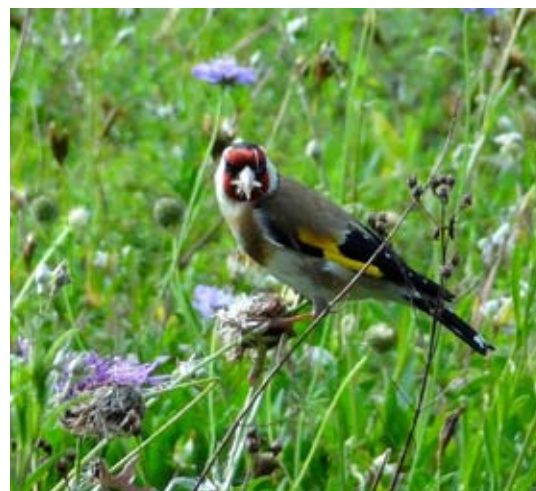
Für Stieglitze bietet die Ruderalflur im inatura-Stadtpark ganzjährig ausreichend Nahrung.