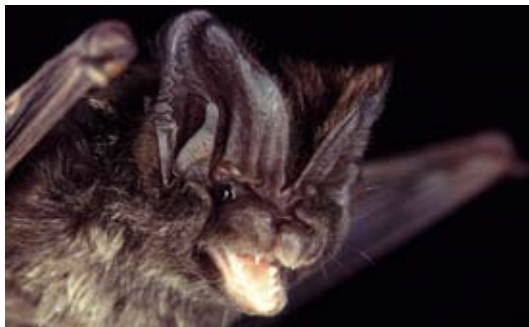
Die Mopsfledermaus ( Barbastella barbastellus ) ist eine typische Waldbewohnerin.