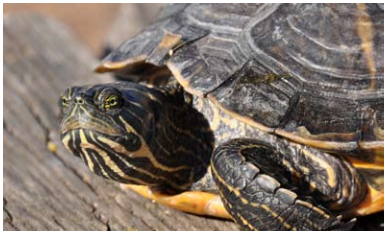
Relaxt: Auch wenn diese Schmuckschildkröte keinen wirklich gefährlichen Eindruck hinterlässt: Da immer mehr von diesen Tieren ausgesetzt wurden, wurde ihre Einfuhr 1997 EU-weit verboten. Mittlerweile konnte eine erfolgreiche Fortpflanzung in freier Wildbahn in Mitteleuropa nachgewiesen werden.