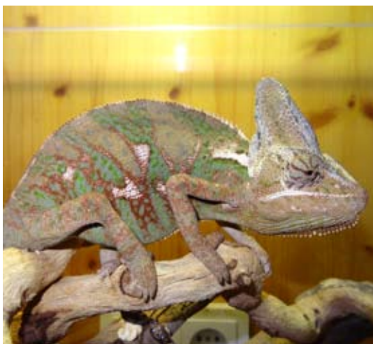
Die Exotenproblematik hat viele Facetten: Dieses Yemenchamäleon – ausgebüxt oder absichtlich freigesetzt – verursachte einen Verkehrsunfall, als es in Bludenz eine Straße überqueren wollte.