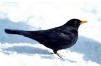
Den Amselbeständen in Vorarlberg geht es gut, in weiten Teilen Deutschlands wurden sie durch das Usutu-Virus stark dezimiert.