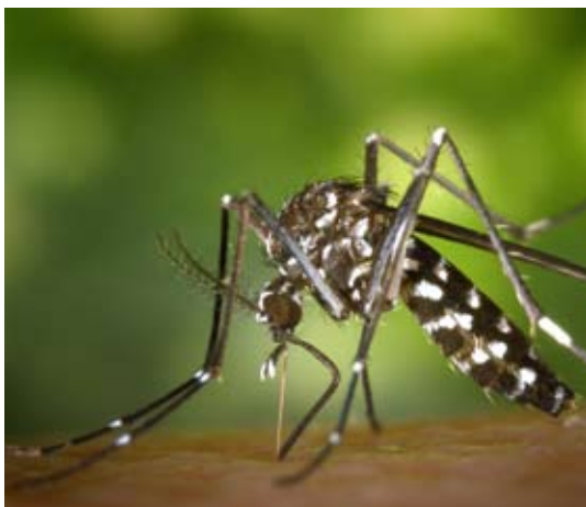
Unangenehm: Die asiatische Tigermücke gilt als einer der Überträger des Dengue-Fiebers, welches bei schwerem Verlauf auch tödlich enden kann. Europa blieb bisher von diesem Fieber weitgehend verschont, 2010 gab es allerdings die ersten Fälle in Südfrankreich und Kroatien.