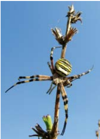
Die Wespenspinne ( Argiope bruennichi) hat ausgehend vom Mittelmeerraum in den letzten Jahrzehnten ganz Mitteleuropa besiedelt.