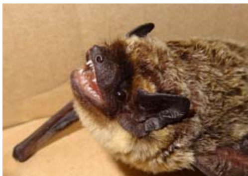
Die Zweifarbfledermaus ( Vespertilio murinus ) ließ sich anhand der Ortungsrufe nicht sicher bestimmen. Die saisonal weiträumig ziehende Art ist eher im Herbst zu erwarten.

Die abstehende Borke eines beschädigten oder kranken Baumes bietet wichtige Quartiermöglichkeiten für «Waldfledermäuse».