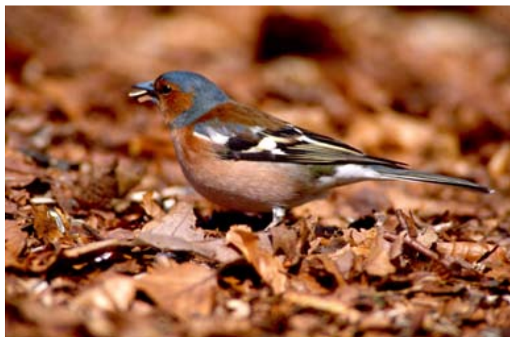
Die Sieger 2012: 931 Buchfinken wurden heuer in Vorarlberg gezählt.