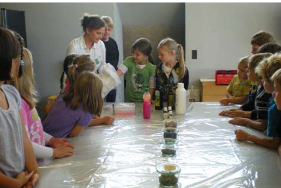
Es ist angerichtet für die Herstellung von Seifen mit unterschiedlichsten Duftnoten: Das Jukebox – Programm «Seifenoper» erfreut sich großer Beliebtheit.