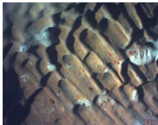
Mikroskopische Aufnahme vom Fruchtkörper des Echten Hausschwammes