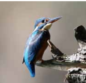
Eisvögel finden auf den gefällten Bäumen einen Sitzplatz für die Jagd.

Die Biberpopulation wird übrigens nicht unendlich steigen, auch wenn ausgewachsene Biber keine natürlichen Feinde haben. Je mehr Reviere besetzt sind, desto schwieriger wird es für die Jungtiere, ein geeignetes Revier zu finden. Zudem reguliert der Stress der Revierverteidigung in den bestehenden Revieren die Anzahl der Jungtiere, die geboren werden.