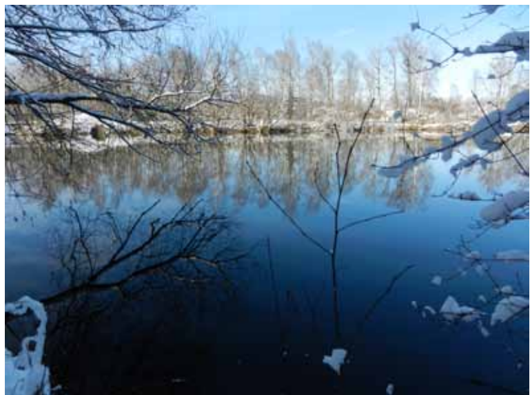
Der Biber ist an zahlreichen Vorarlberger Gewässern wieder heimisch.