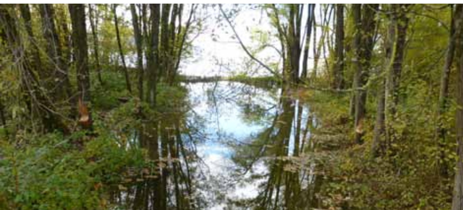
Durch Biberdämme verbreitern sich Gewässer und neue Flachwasserzonen bieten Amphibien ein Zuhause. (Foto: Agnes Steininger)

Agnes Steininger (Bibermanagement Vorarlberg)