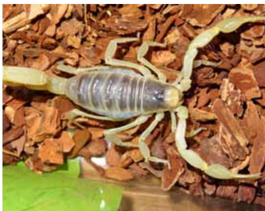
Gelber Mittelmeerskorpion

Zum Schwerpunkt «Wespen und Hornissen» veranstaltete die inatura-Fachberatung in Kooperation mit dem Landesfeuerwehrverband zwei eintägige Praxisseminare mit hochrangigen Experten. Infolgedessen gelangen der Dornbirner Feuerwehr bereits mehrere Umsiedlungen von Hornissennestern. Zusätzlich folgte eine Spezialveranstaltung für die Lustenauer Feuerwehr zum Thema «Gifttiere» mit Klaus Zimmermann als Referent.