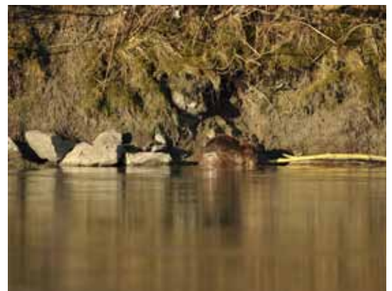
Biber haben ein festes Revier, das sie gegen andere Biber verteidigen.