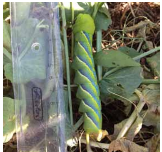
Raupe des Totenkopfschwärmers