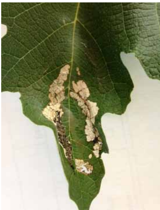
Fraßspuren vom Feigen-Spreizflügelfalter