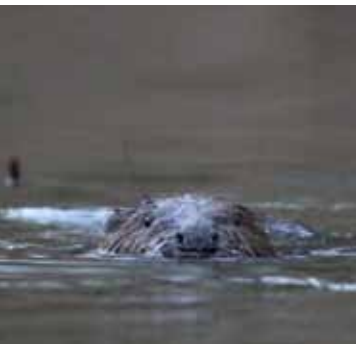
Biber fällen nur im Winter Bäume, um an Nahrung zu gelangen.

Der Biber ist ein Ur-Vorarlberger, wie steinzeitliche Knochenfunde aus dem Rheintal beweisen. Da sein Fell und sein Fleisch begehrt waren, wurde er, wie in großen Teilen Europas, auch in Vorarlberg ausgerottet. Seit 2006 ist er nun wieder da und erobert langsam die Vorarlberger Gewässer zurück. Die ersten Biber kamen vermutlich aus der Schweiz zu uns.